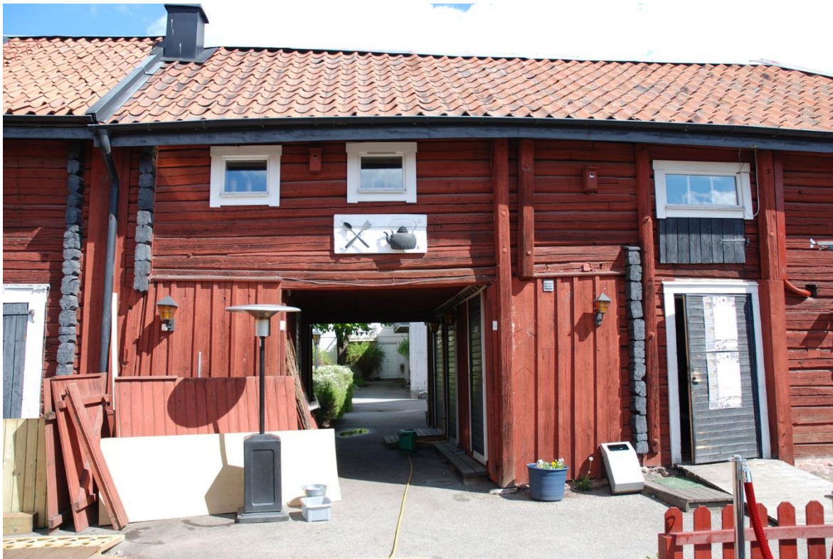
Norrmanska gården, portlider till innergården och entré till restaurangen.