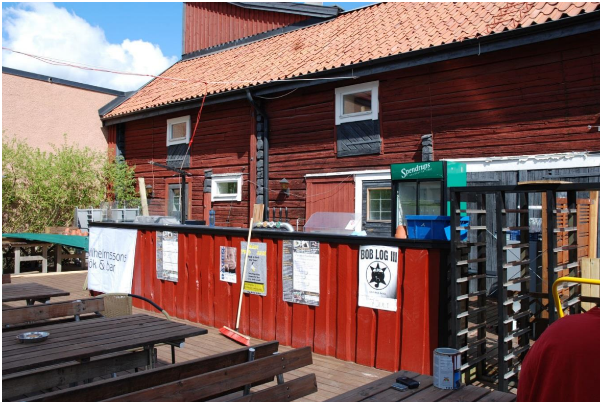
Baren från sedd från sydöst.