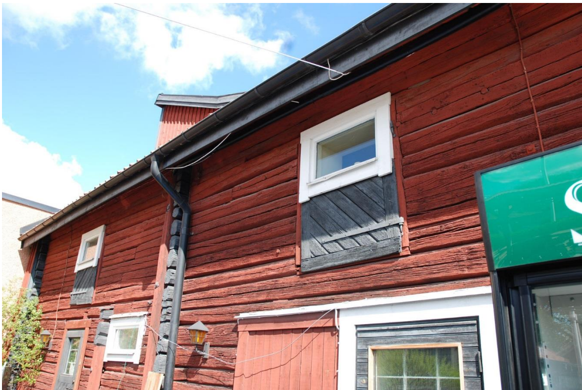
Infästningar för segelduken kan behöva ske i den timrade väggen eller i takfoten.