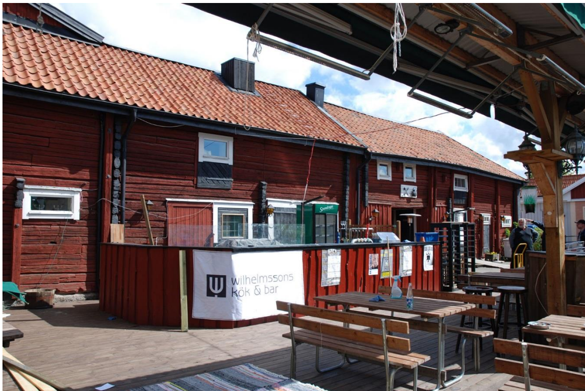
Kring den flyttade bardisken har panelen är måla röd.