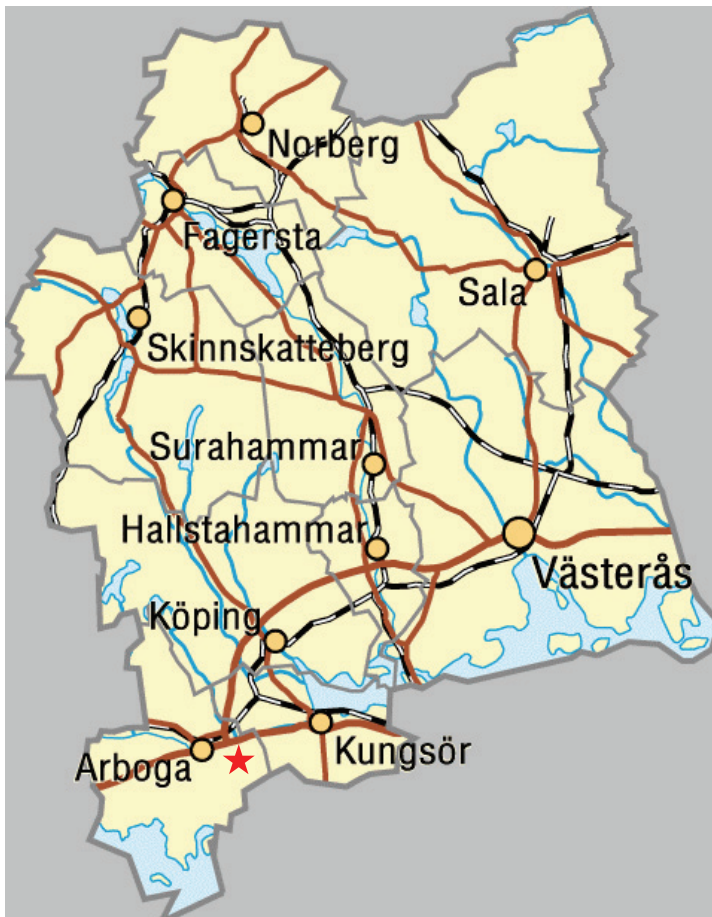
Bild 1. Karta över Västmanland. Den röda stjärnan markerar var Säterbo kyrka är belägen.