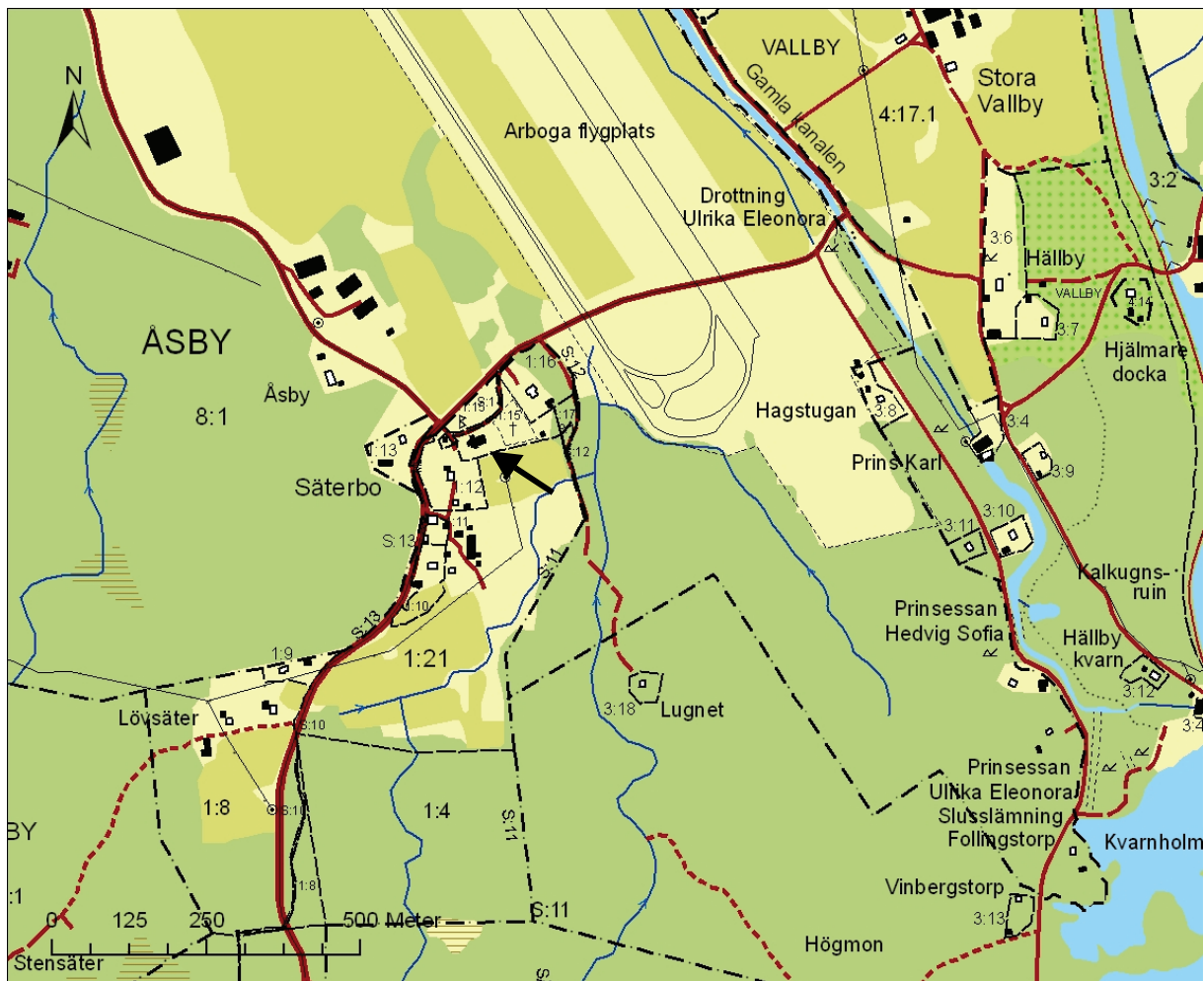
Bild 2: Karta över Säterbo. Kyrkan är markerad med en svart pil. Utdrag ur digitala fastighetskartan.