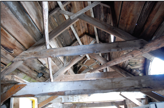
Byggnadens innertak före restaurering.