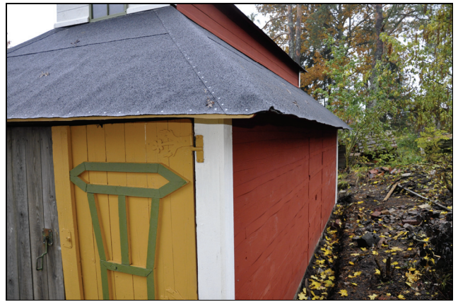
Tre av byggnadens fasader är vita medan baksidan är rödmålad.