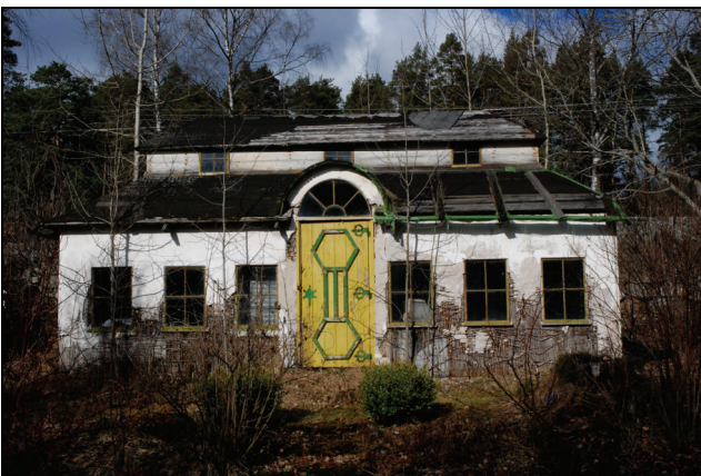
Byggnaden var före restaurering i mycket dåligt skick, framförallt taktäckningen av papp hade stora brister.