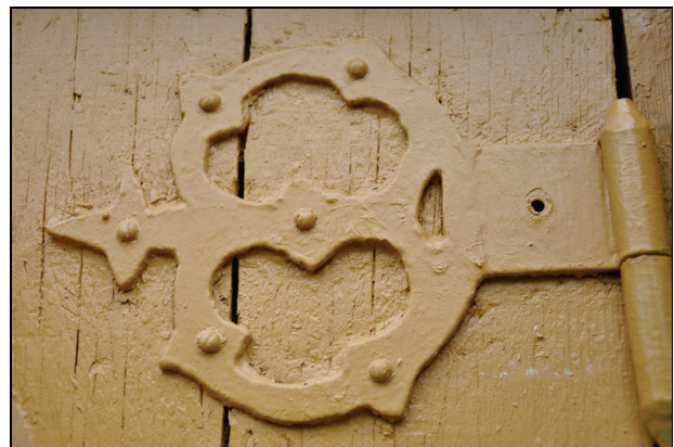
Ett av beslagen på dörren ovan, före och efter restaurering.