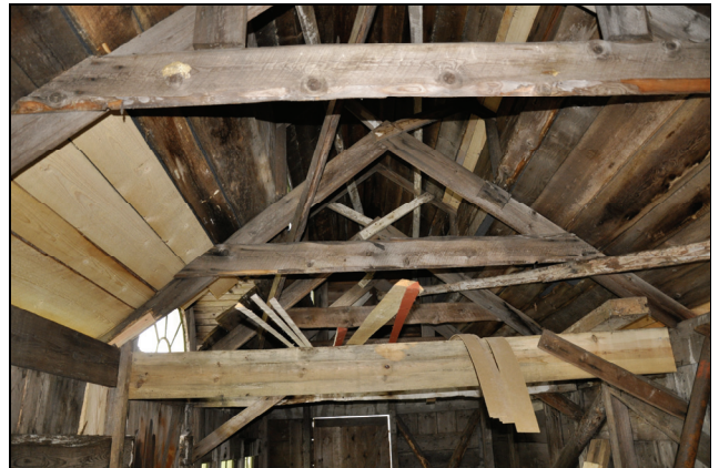
Byggnadens innertak efter restaurering. Taket var vid närmare undersökning i bättre skick än befarat och endast ett fåtal brädor ersattes.