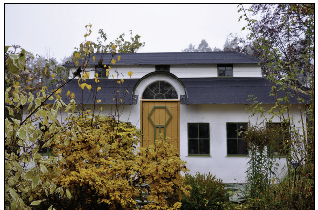
Efter att taket lagts om, fasaden putsats och målats samt att fönstren restaurerats är byggnaden återigen ett ovanligt och imponerande inslag i trädgården.