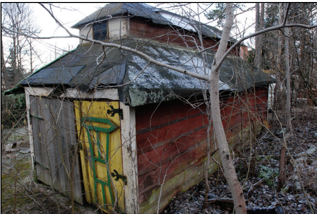
Mot baksidan var marknivån hög och sly och mindre träd växte nära fasaden.