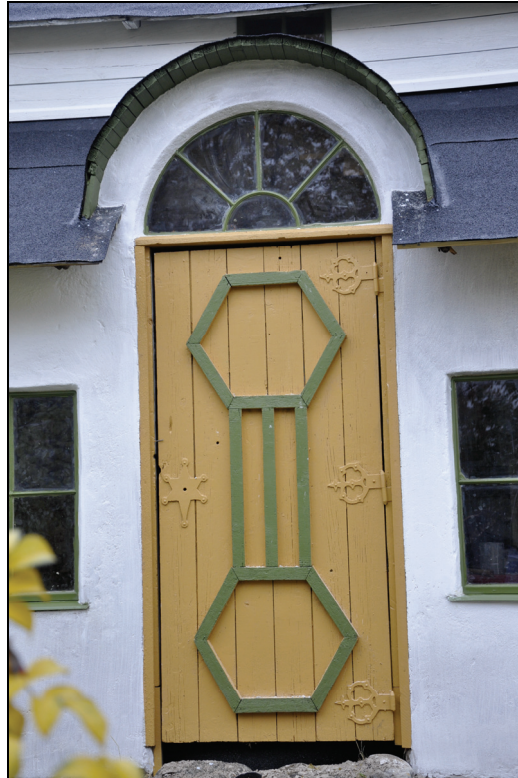
Ingången på huvudfasaden före och efter restaurering.