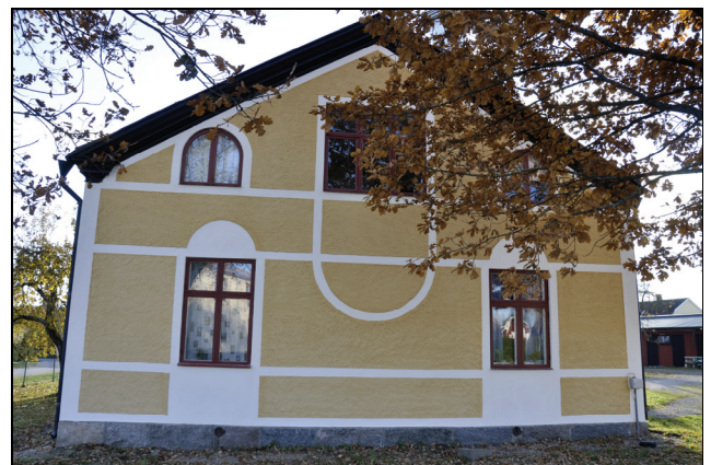
Den norra fasaden efter restaurering.