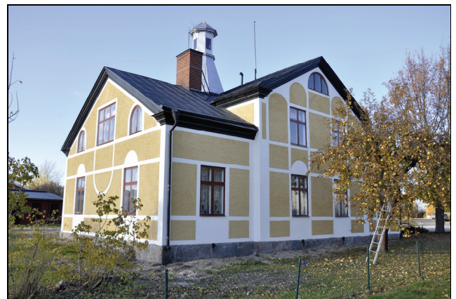
Den södra och östra fasaden efter restaurering.