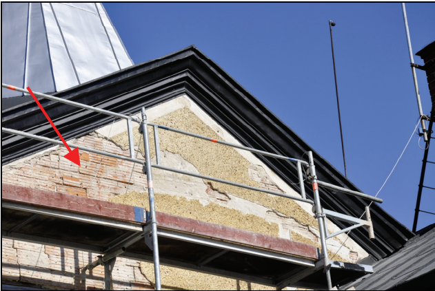
Under putsen satt spiktegeln på timmerstommen.