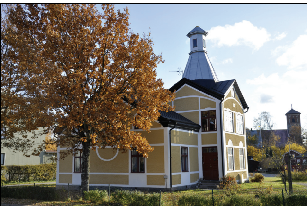
Den norra och västra fasaden efter restaurering.