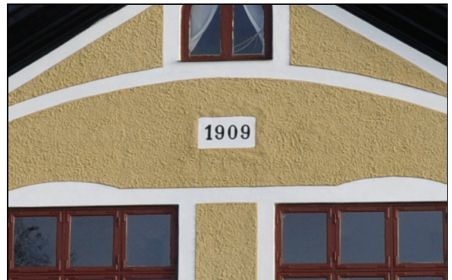
Siffrorna fylldes i med svart linoljefärg.