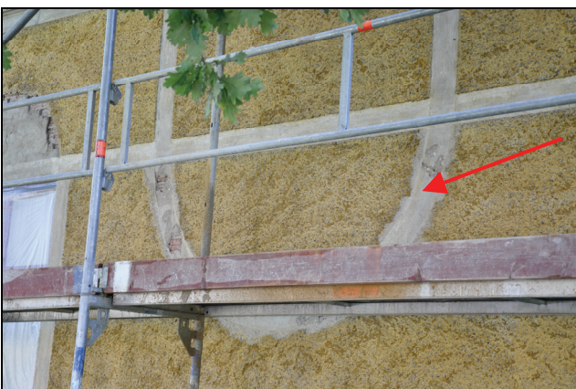
Samtliga fasadens äldre slätputsade partier fanns kvar under den sekundära spritputsen.