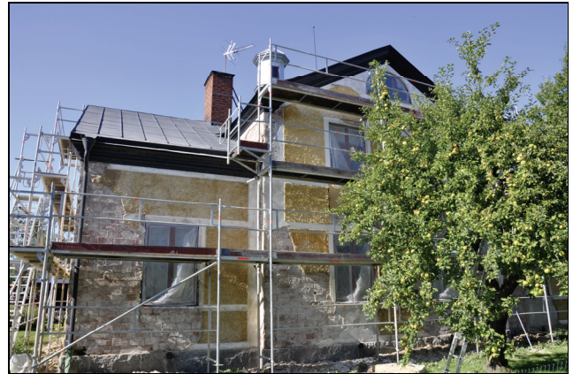
Byggnadens östra fasad.