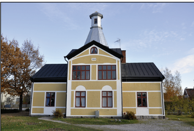
Den västra fasaden efter restaurering.