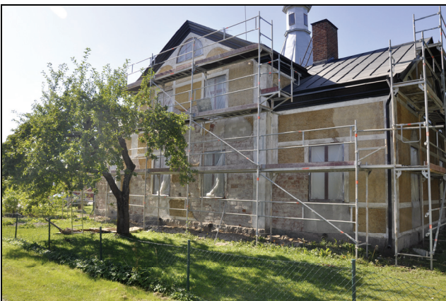
Partierna med bomputs var större är beräknat.