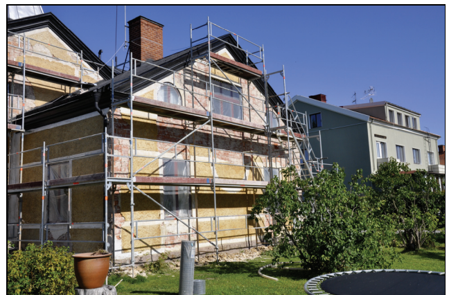
Mot söder föll putsen på fasadens övre del ned.