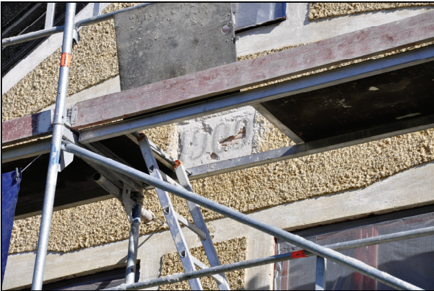
Ett överputsat parti mot väster visade sig dölja årtalet 1909.