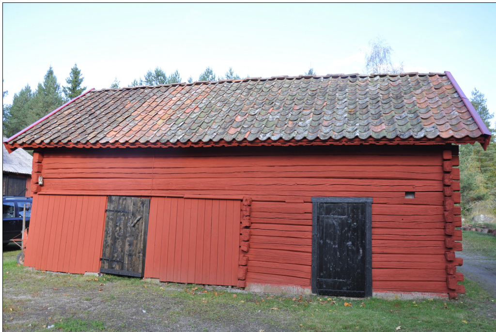
Byggnadens framsida efter restaurering.

Byggnadens tak har lagts om utan särskilda åtgärder på undertaket. Ovanpå undertaket lades oljehärdad board och därpå ny läkt. Till omläggningen av taket användes begagnat enkupigt lertegel. Vindskivorna har bytts och dörrarna har lagats vid behov. Hela byggnaden har rödfärgats och dörrarna målats svarta.