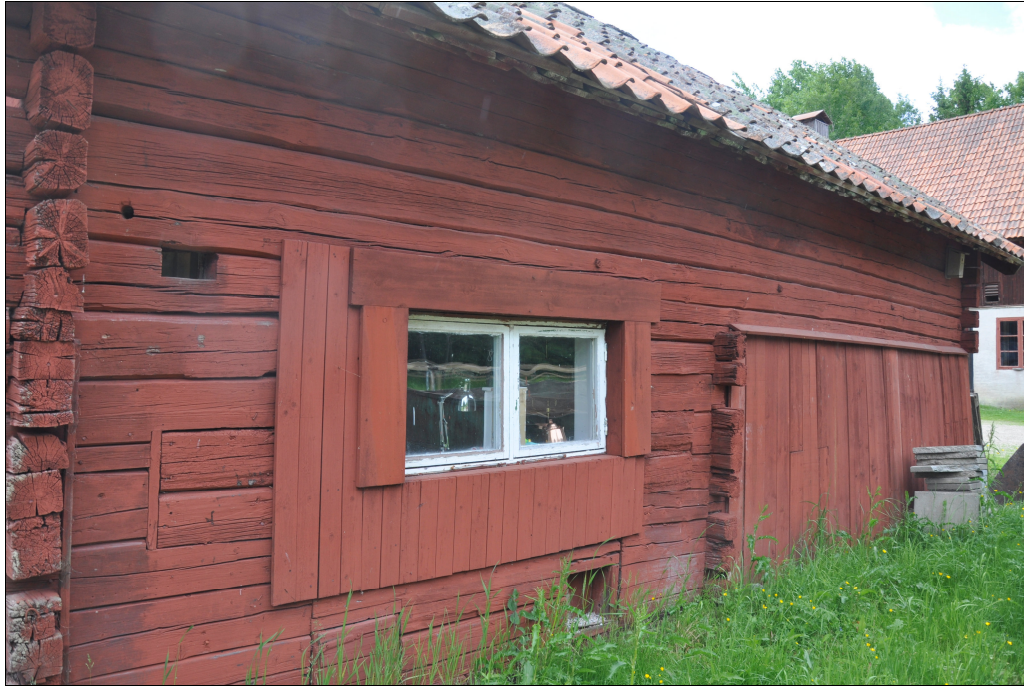
Byggnadens baksida före restaurering.