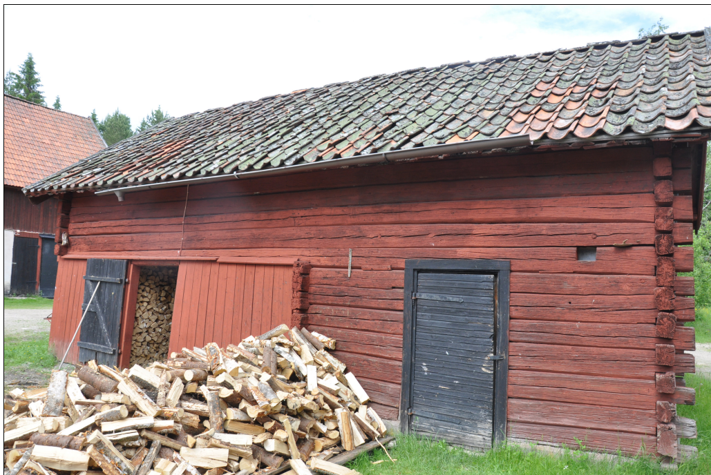
Byggnadens framsida före restaurering.