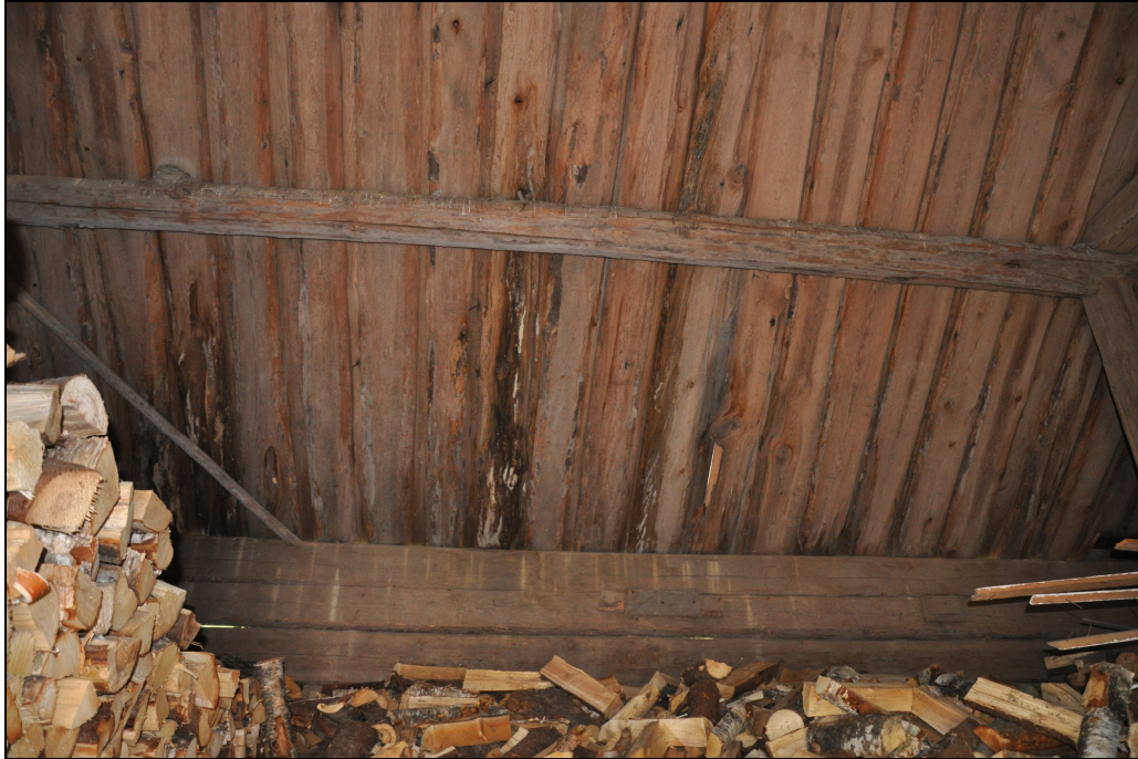
Rötskador i undertaksbrädor

Byggnadens tak var i dåligt skick, med tegelpannor som halkat ur läge eller var uttjänta på grund av ålder. Till följd av vattenläckage fanns vissa mindre rötskador på undertaket. Vindskivorna var i dåligt skick liksom dörrarna.