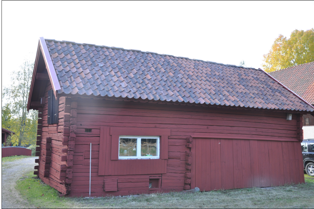
Byggnadens baksida efter restaurering.