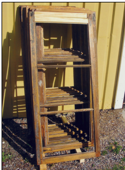
Bågar under renovering, lagade understycken.