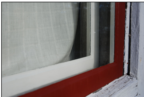
Fönster efter renovering.