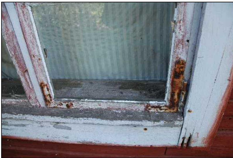
Fönster före renovering, trasiga rutor, bortfallet kitt, flagnad färg och rostiga hörnjärn.