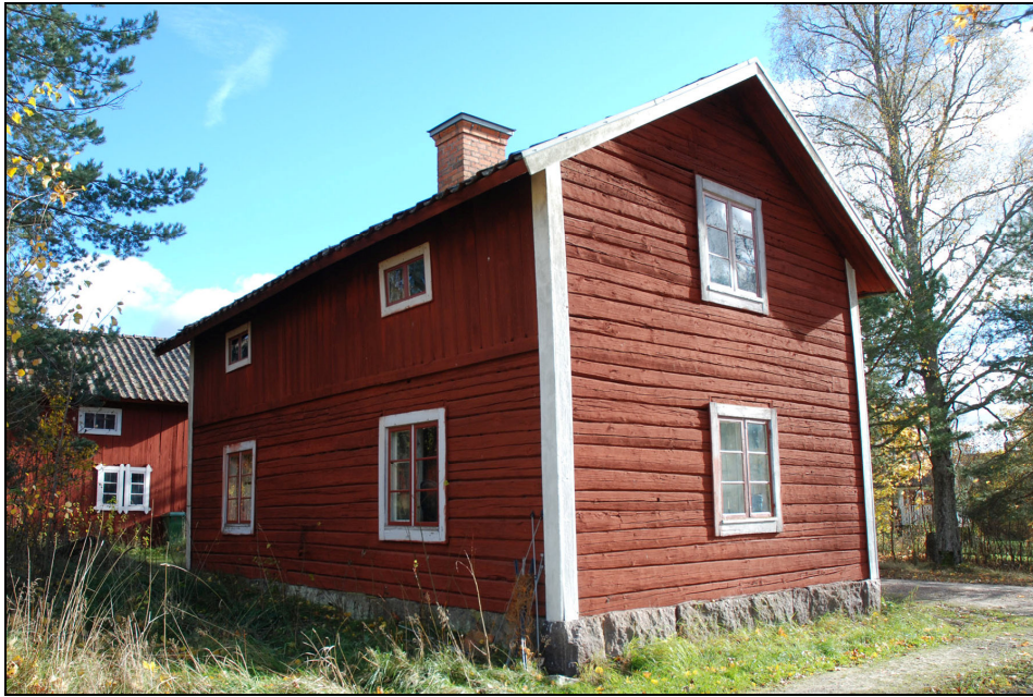
Bagarstugan efter fönsterrenovering, oktober 2010.