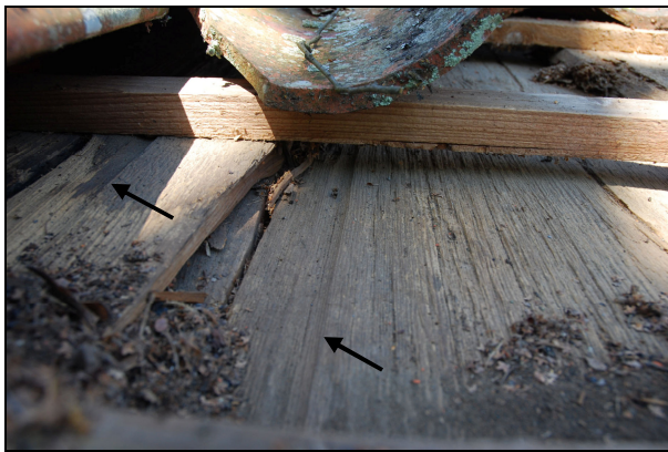
Pilarna markerar vatthyllade spår i gamla locktaket.