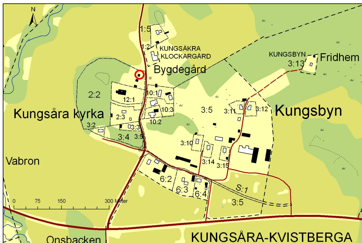
Kartan visar bodens läge strax nordöst om kyrkan. Utdrag ur digitala fastighetskartan från 2004.