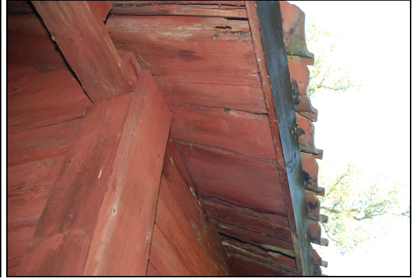
Fotbrädan spikad i ändträt på det gamla locktaket med rötskadat undertak som följd.