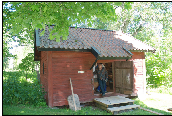
Boden innan takomläggning, i bild syns Kjell Lindbom.