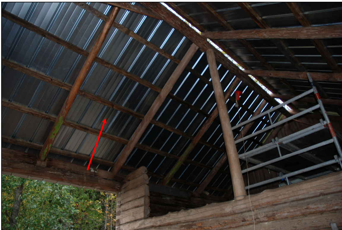
Omlagt tak och en utbytt sparre, 27 september 2010. Nockplåten återstår att montera.