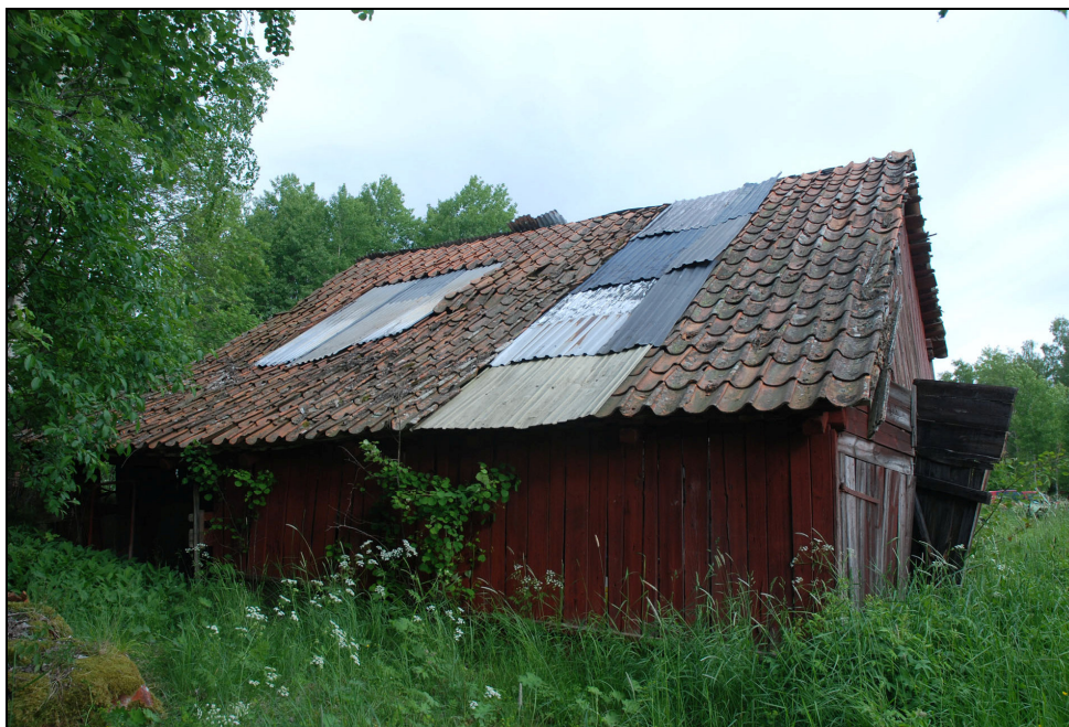
Byggnadens baksida med tillbyggnad, innan takomläggning Juni 2010.