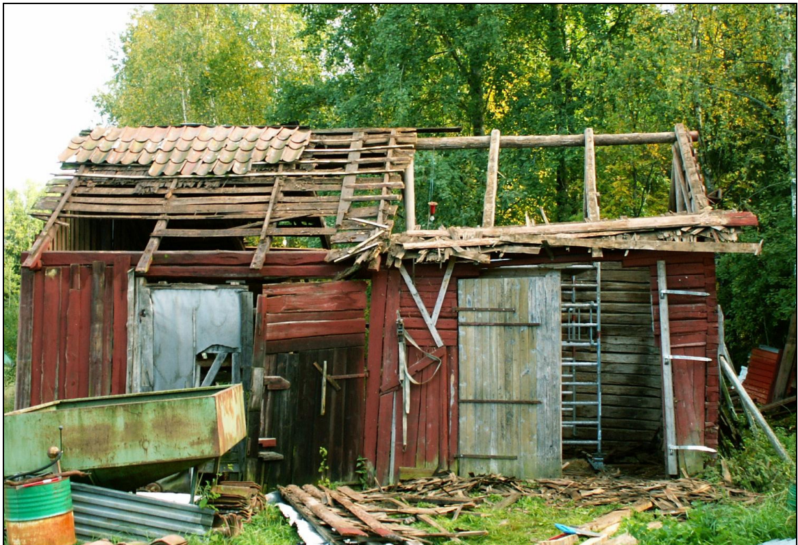
Pågående takarbete.