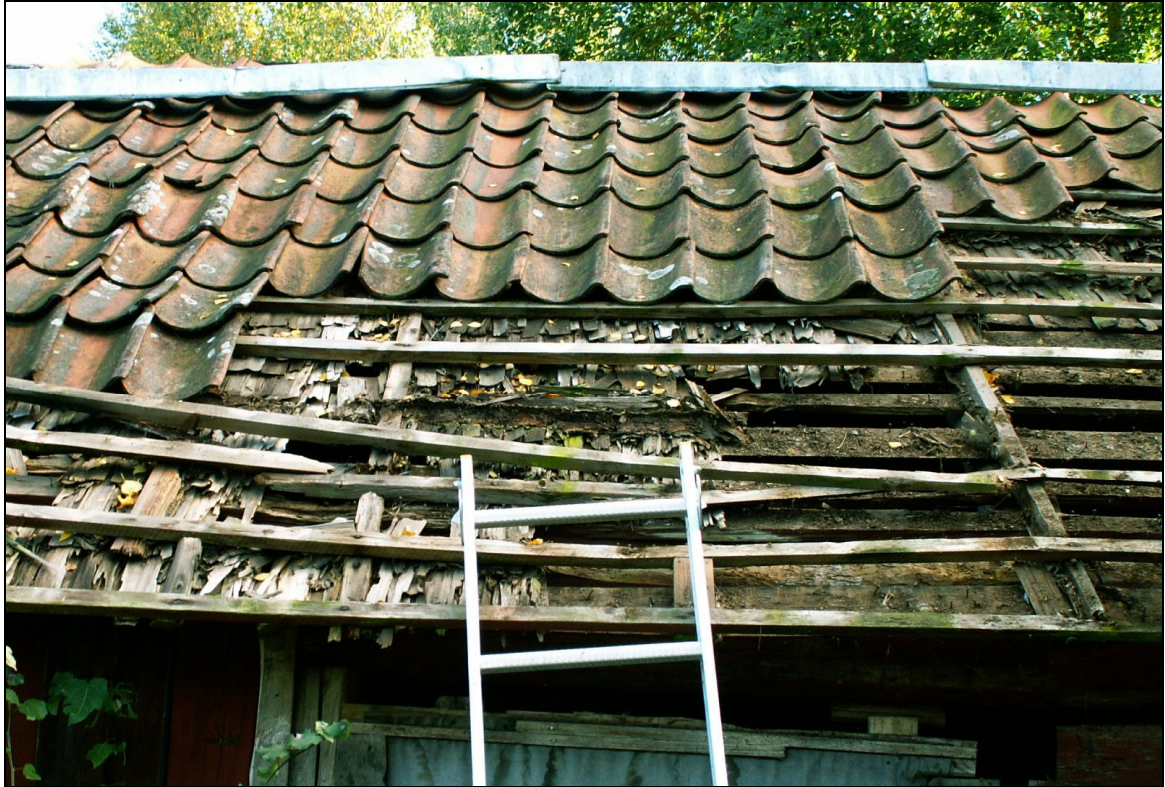
Avplockning av taktegel.