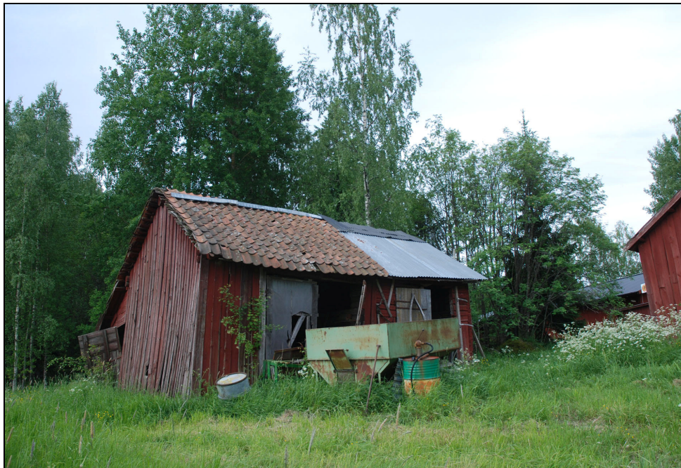
Byggnaden innan takomläggning, Juni 2010.