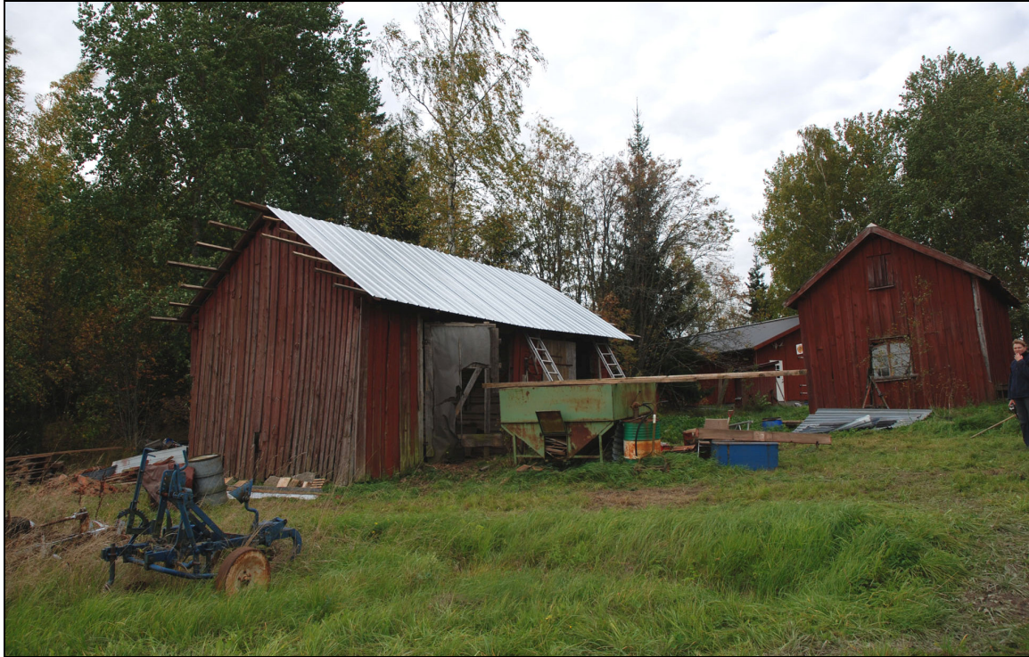
Omlagt tak, 27 september 2010.