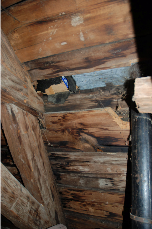
Hål har sågats upp i undertaket vid något tillfälle.