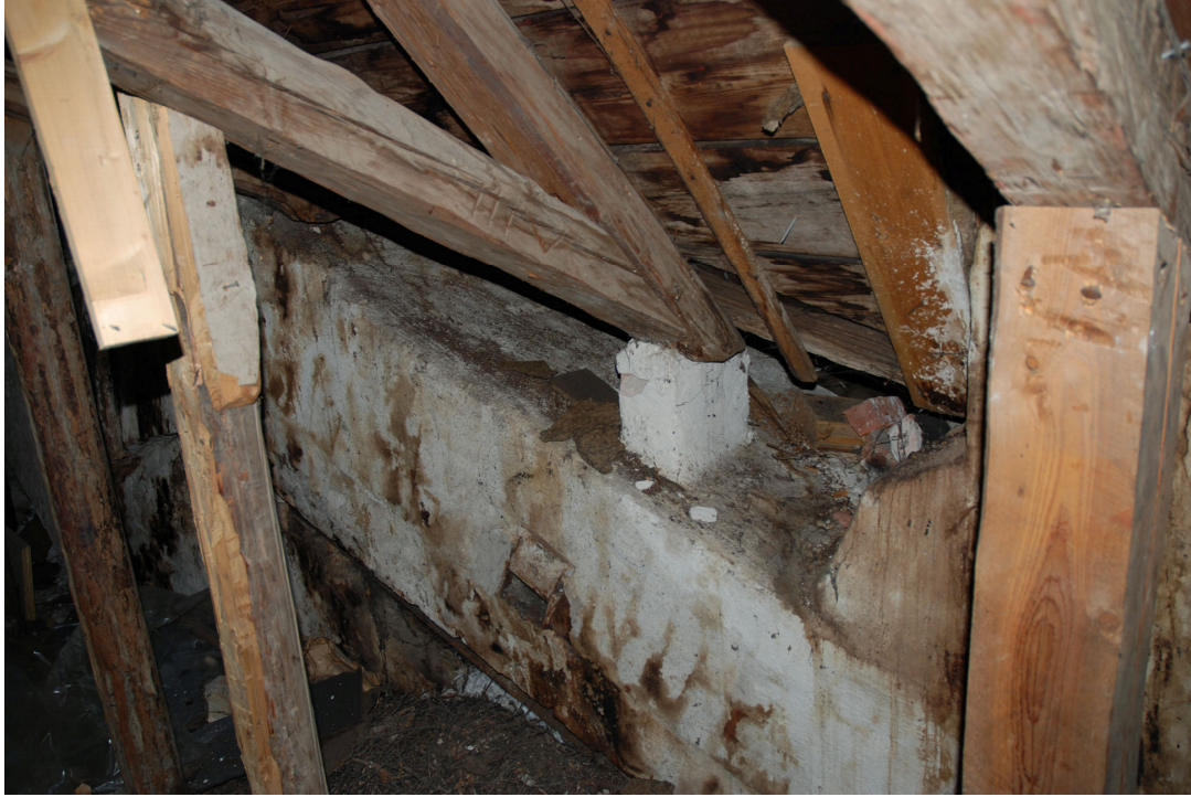
Murstocken med yngre murad stötta.