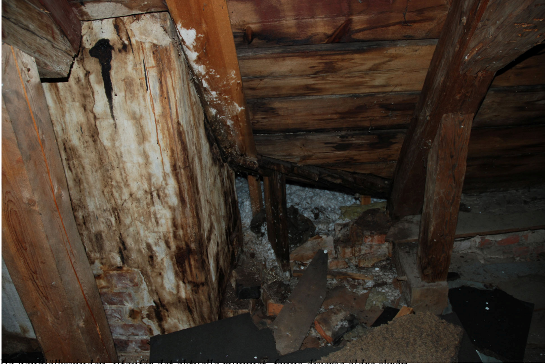
På hantverksboden, utanför det aktuella rummet, fanns diverse äldre skrap.