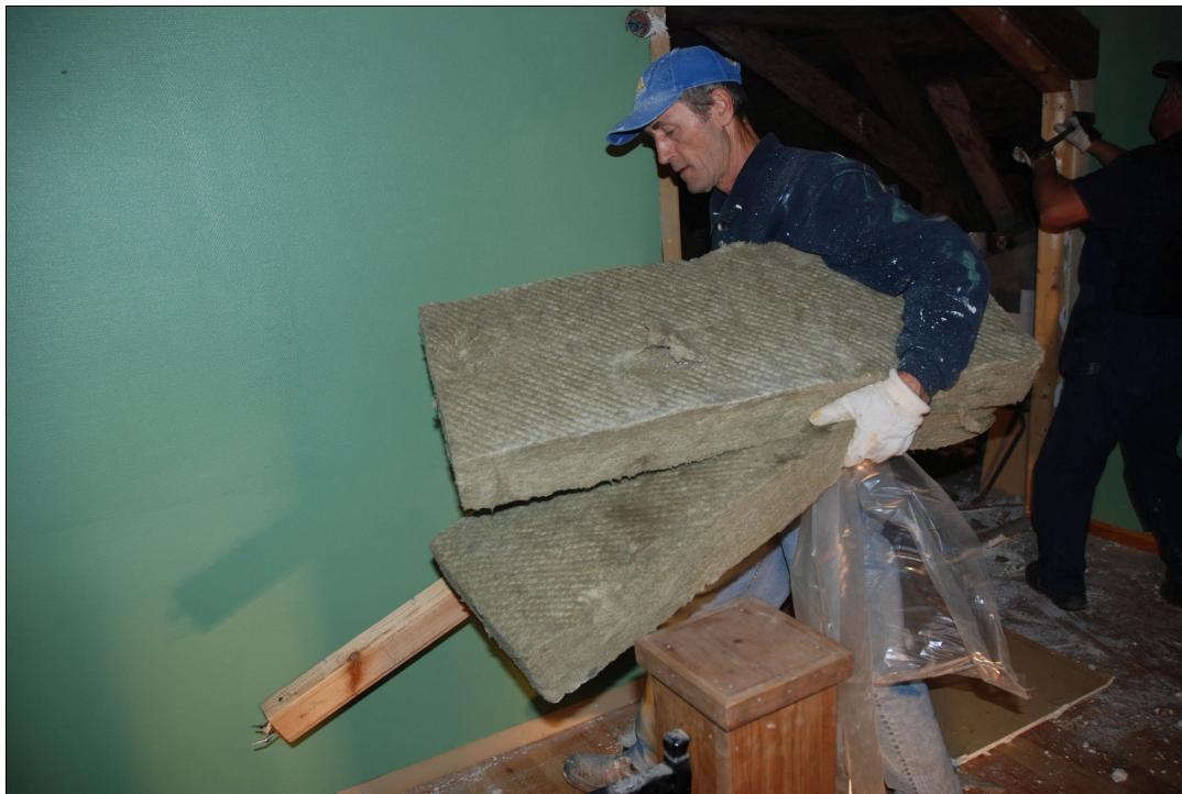
Självta rivningsarbetet skedde för hand.