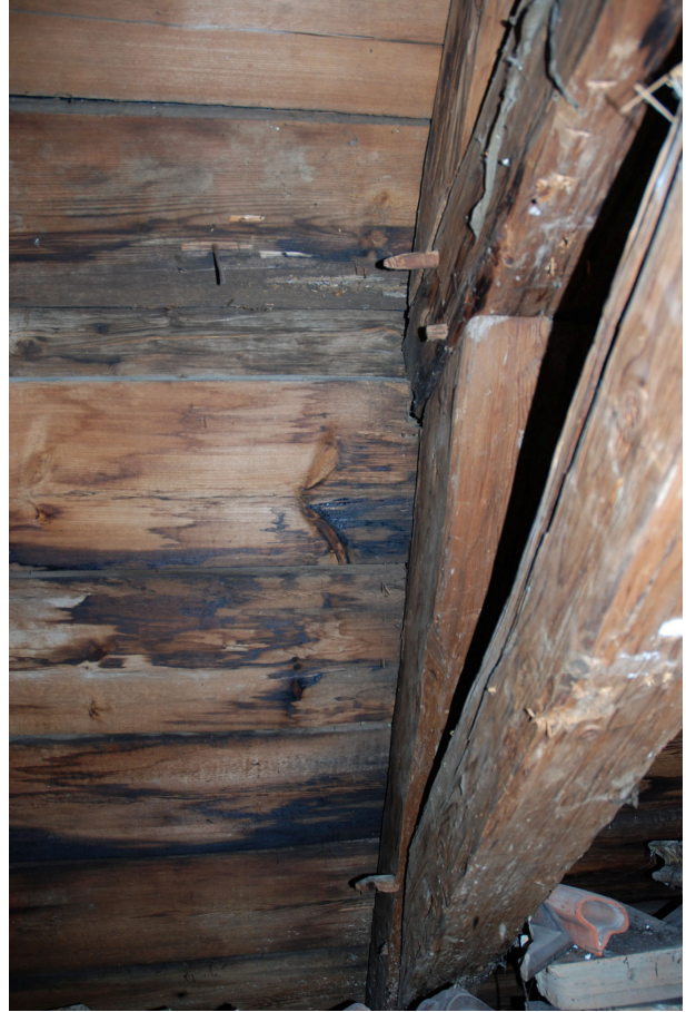
På undertaket fanns äldre, mindre fuktskador.