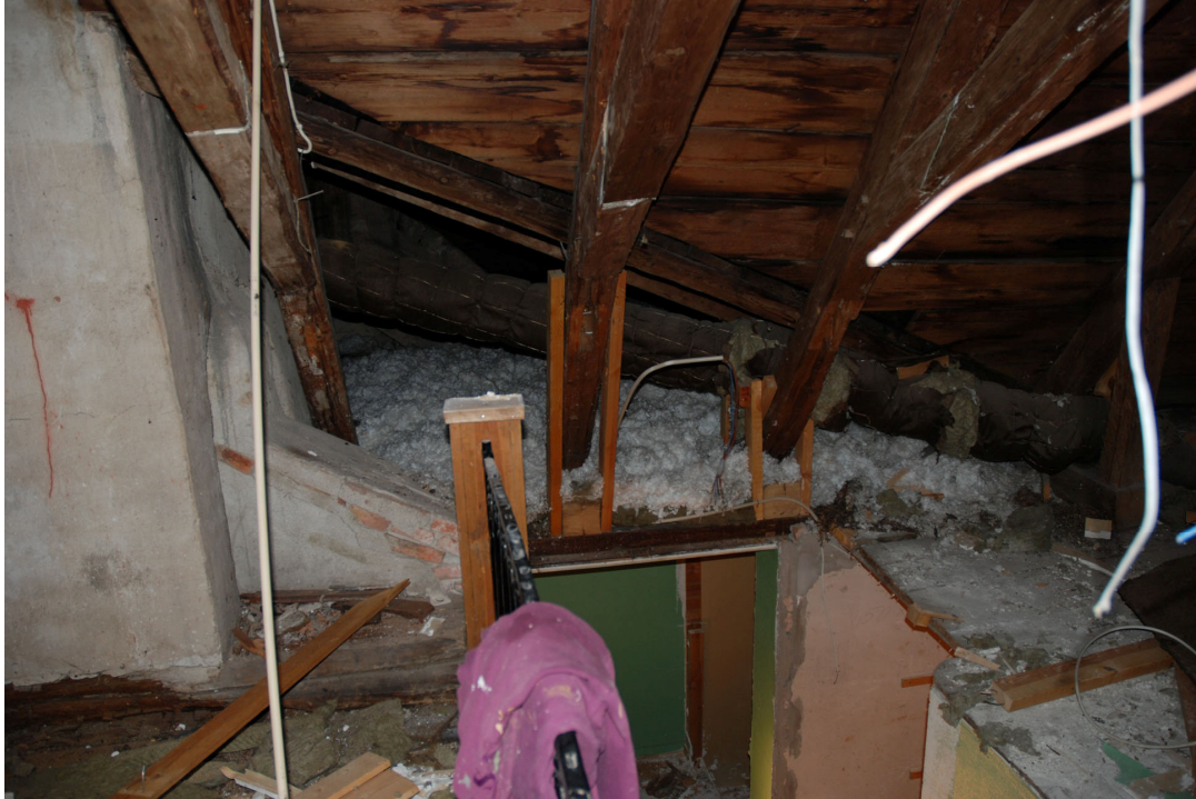
Den sekundära trappan är belägen precis invid murstocken.