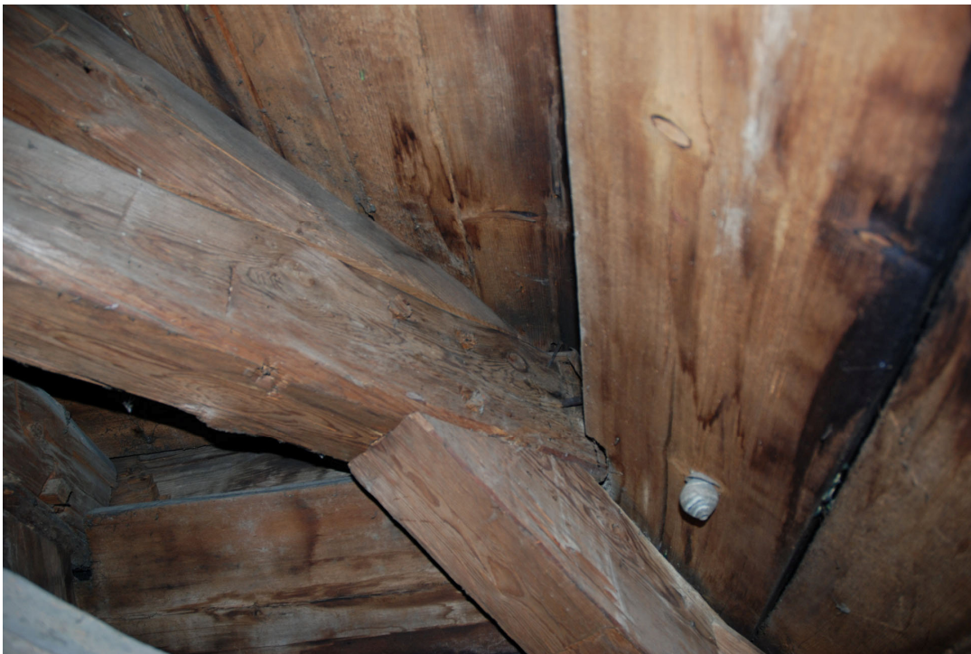
Detalj av bjälksystemet.