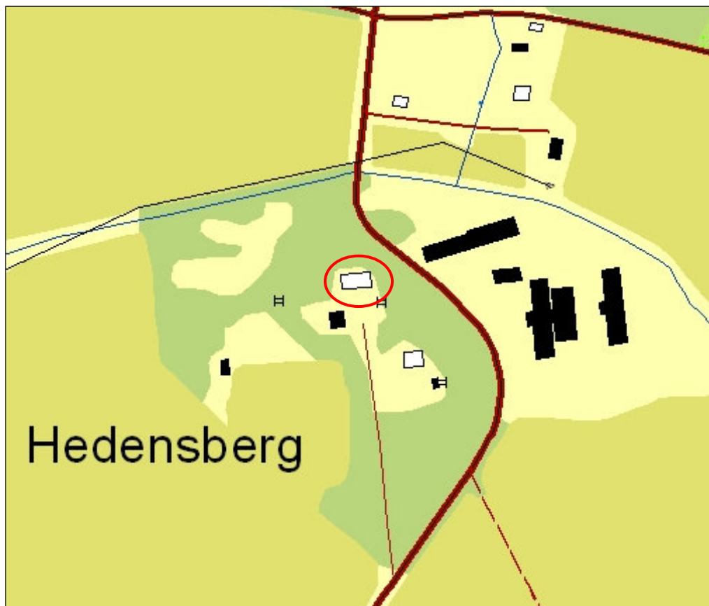
Utdrag ur digitala fastighetskartan 2004, skala 1: 5000. Den aktuella byggnaden är inringad.