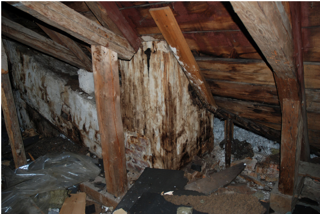
På murstocken fanns äldre spår av vatteninrinning.