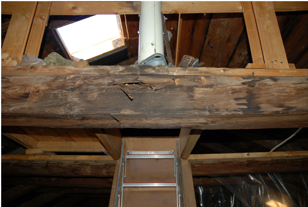
En av takbjälkarna fungerar som bas till en flaggstång.