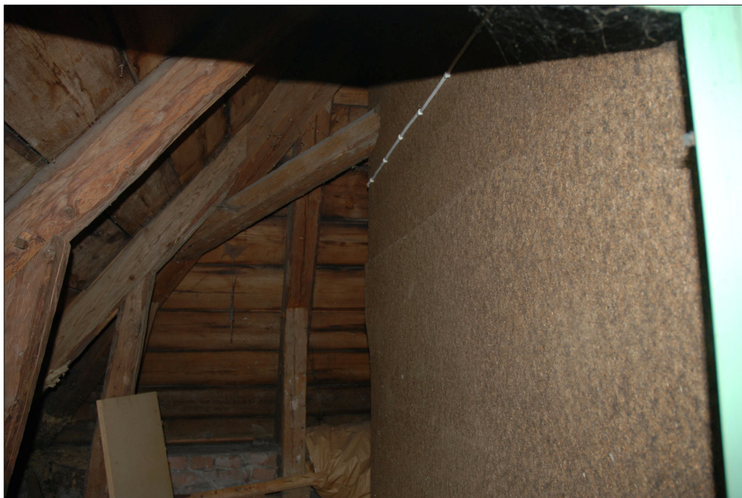
Rummets utsida var klädd med träfiberskivor och omålad.