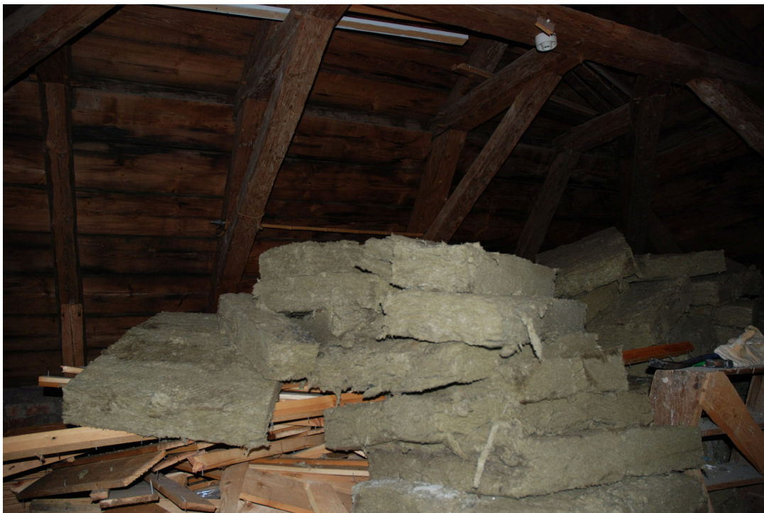
En betydande mängd skivisolering hade tagits ned.