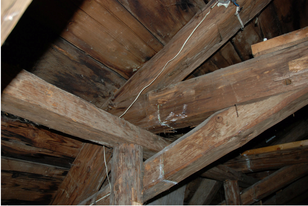
Detalj av bjälksystemet.