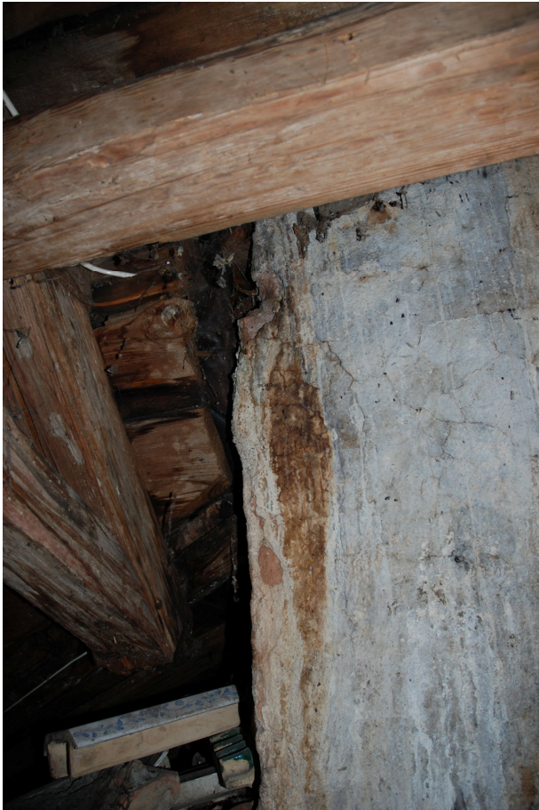
Detalj av murstocken