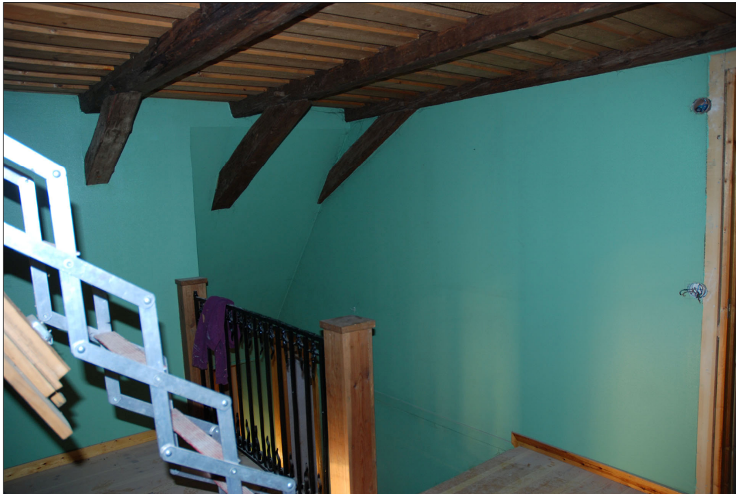
Rummet hade tidigare fungerat som sällskapsrum men saknade efter att den nya fastighetsägaren tillträtt egentlig funktion.