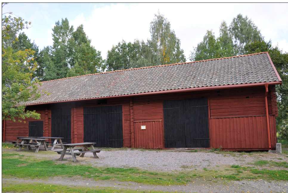
Logens fasad in mot gårdsplanen efter takomläggningen.

Samtliga tegelpannor plockades ned och deras skick bedömdes. Eftersom så pass få pannor var möjliga att återanvända togs beslutet, i samråd med antikvarisk expert, att lägga ett nytt enkupigt lertegel på takfallet ut från gårdsplanen. De äldre pannorna skulle läggas på takfallet in mot gårdsplanen. Underlagspappen togs bort varefter undertaket besiktigades och visade sig vara utan skador. På hela undertaket lades takboard, därefter ny läkt innan tegeltaket lades. Det äldre takteglet var för glest lagt och vid den nya läggningen tillkom en längsrad med tegel. Nockpannorna köptes nya och var av en något större modell, detta för att minska risken för vattenläckage. Nya vindskivor specialbeställdes i längder om 5,70 meter. Nya plåtdetaljer sattes upp: vindskiveplåtar, hängrännor och stuprör. Plåtdetaljerna är röda.