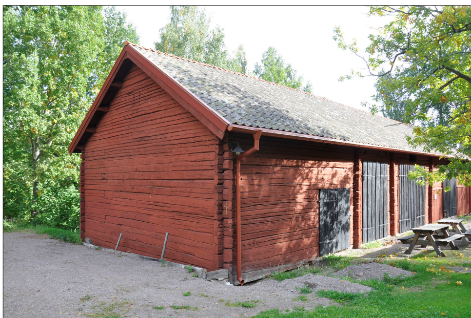
Det sydvästra hörnet av logen. De nya plåtdetaljerna är röda för att smälta in i fasaden. .