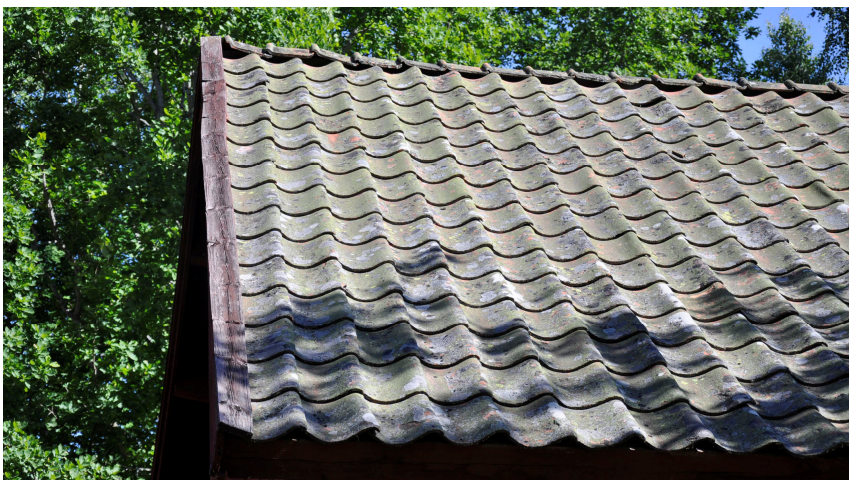
Takteglet var glest lagt och beväxt med lavar.