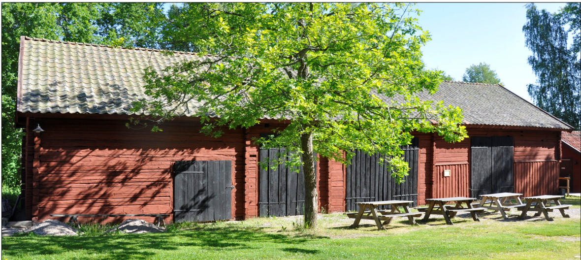
Logens fasad in mot gårdsplanen.

Tegeltaket på logen var i dåligt skick. Behovet av en omläggning var stort för att förhindra att vatten skulle börja läcka in i boden.