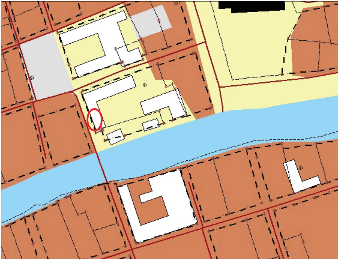
Utdrag ur digitala fastighetskartan 2004, skala 1: 2000. Det aktuella partiet är markerat med en ring.