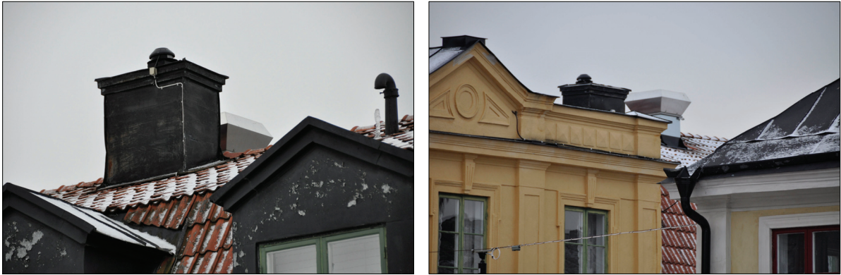
Fläktdonet bredvid skorstenen, efter åtgärd. Bildnr Vlm_kmvIM-951 och Vlm_kmvIM-976.