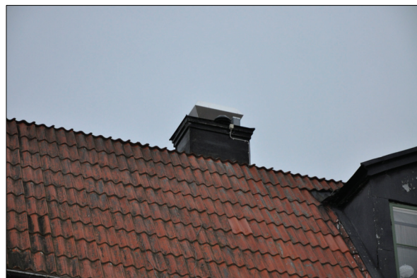
Fläktdonet ovanpå skorstenen, före åtgärd.