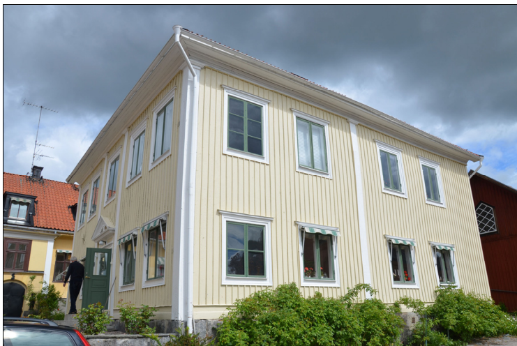
Gårdshuset från sydväst. Bildnr Vlm_kmvIM-1374

Wettergrenska huset är en vinkelbyggnad i två våningar under ett flackt sadeltak, täckt med enkupigt tegel. Grunden är en fogad stensockel i natursten. Fasaden är klädd med locklistpanel och målad i blekt gul kulör. Fasaderna är klassicistiskt dekorerade med lisener med enkelt utformade kapitäl. Samtliga snickerier är målade i vitt. Byggnaden har två ingångar, dels på huvudfasaden, dels på bakbyggets norra fasad. Huvudingången är en omsorgsfullt utformad entré med klassiserande drag. Dörren är en dubbeldörr med fönster i varje dörrblad målad i grönt. Den bakre entrén har likadana dörrar men utan dekorerande omfattning. Denna dörr är vitmålad. Bredvid den bakre dörren finns ytterligare en ingång med enklare enkeldörr klädd i liggande panel målad i grönt. Byggnadens samtliga fönster, utom två blindfönster, byttes på 1950-talet och är kopplade tvåluftsfönster utan spröjs. De äldre blindfönstren är förmodligen ursprungliga och är enkelbågar med två spröjs och tre rutor i varje båge. Samtliga fönsterbågar är målade i grönt.