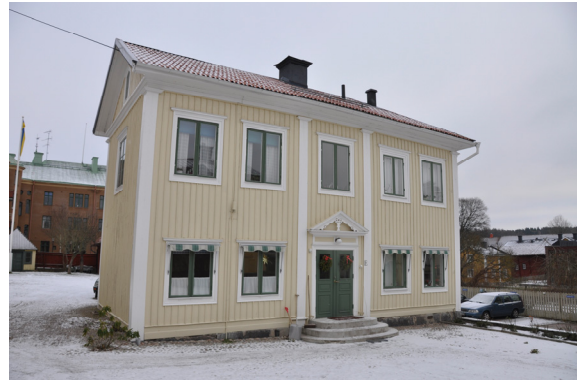
Gårdshuset efter restaurering. Bildnr Vlm_kmøIM- 977, 978, 979, 981.