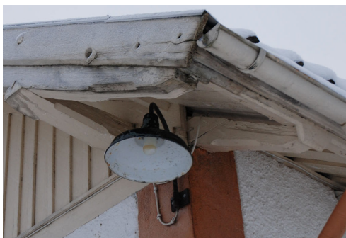
Delar av virket i takutsprånget var rötskadat. Vlm_kmvLS-915.