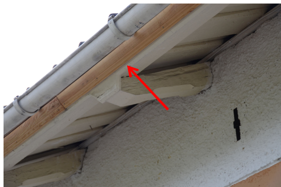
Nya profilhyvlad fotbräda i kådrick kärnfura innan målning. Vlm_kmvLS-1979.

Fotbrädorna var delvis rötskadade och ersattes med nytillverkade brädor lika originalet. Brädorna ska målas med linoljefärg i likadan kulör som tidigare. Färgen fanns inte tillgänglig under den tid ställningen var uppe och föreningen beslutade att brädorna skulle målas 2012 istället. I avvaktan på målning ströks brädorna med en blandning av en del kokt linolja blandat med en del balsamterpentin. NCS-koden för den ljusbeiga kulören som brädorna skall målas i är S1010-Y10R. Pigmenten utgörs troligen av brun umbra eventuellt lite guldocker.