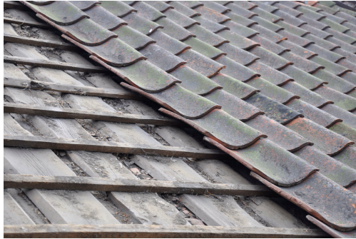
Enkupigt lertegel ligger på bärläkt spikad i undertakets lockbrädor. Vlm_kmvFE-13 visar en skadad panna och Vlm_kmvFE-9 visar taket under lerteglet.