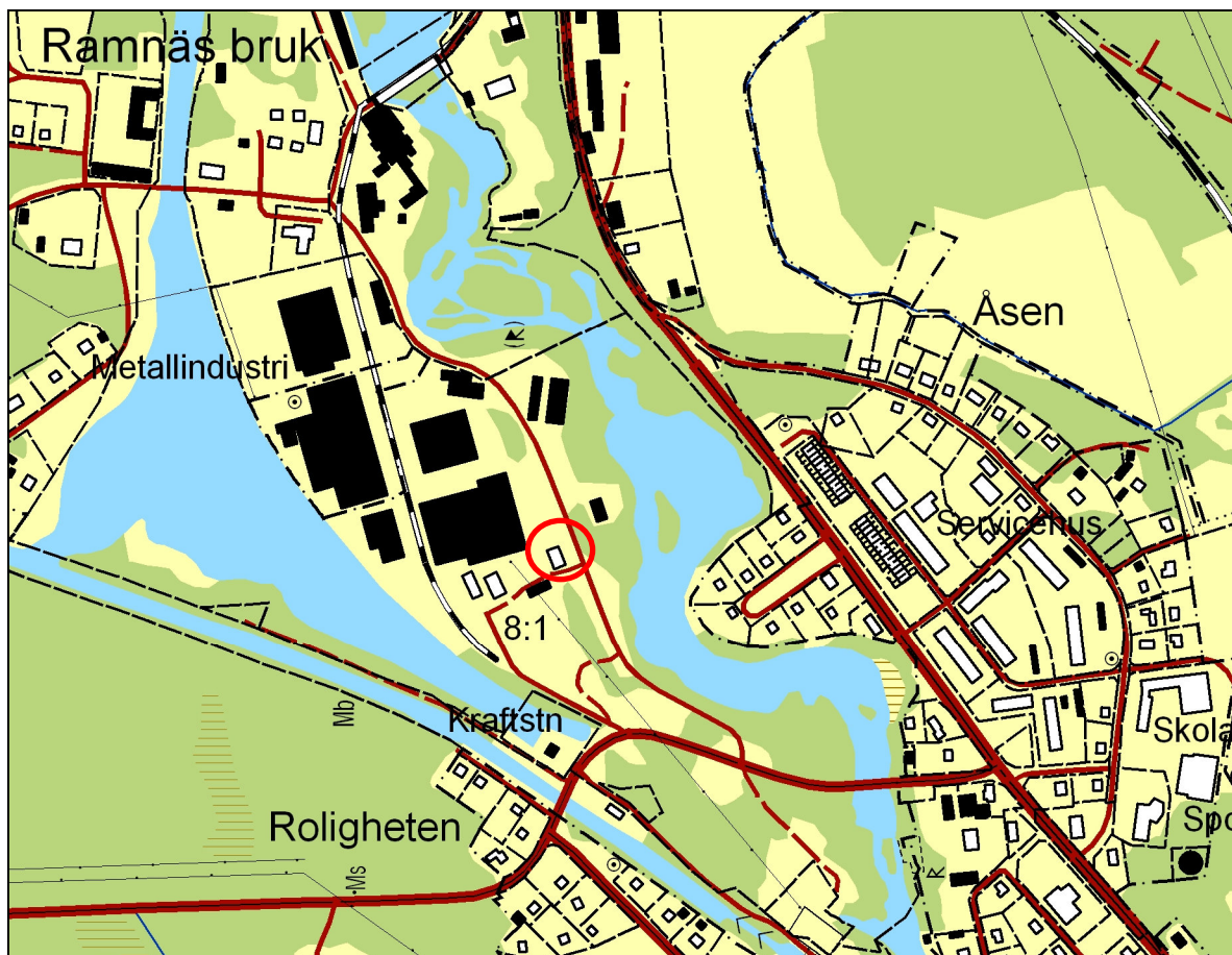
Kartan visar byggnadens läge med röd ring. Utdrag ur digitala fastighetskartan från 2004 Skala 1:8000.

Byggnaden var en av ursprungligen sex arbetarbostäder som uppfördes utmed Bruksgatan. Idag finns endast Söderhammar och ytterligare en av dessa kvar. Byggnaden hyrs sedan 1995 av Ramnäs-Virsbo hembygdsförening. I samband med att hembygdsföreningen fick hyra byggnaden påbörjades reparationer interiört och exteriört, till en mindre del med hjälp av bidrag från Länsstyrelsen (Dnr 222-2402-96). Bl a återfördes byggnaden till äldre (troligen ursprunglig) exteriör färgsättning. Ett rum iordningställdes som skolmuseum och i en lägenhet, om ett rum och kök, återskapades en smedsbostad. På vinden har gamla verktyg och redskap samlats till en utställning. Byggnaden används ofta och regelbundet, som möteslokal och för olika aktiviteter.