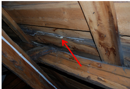
Fuktfläckar. Vlm_kmvLS-905 och Vlm_kmvLS-904.