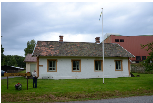
I bild syns Lennart Källman från hembygdsföreningen. Foto från öster, Vlm_kmvLS-1982.

Den aktuella byggnaden är en envånings byggnad med oinredd vind (som användes som sovutrymme för de skiftarbetande smederna under sommarhalvåret). På bottenvåningen finns fyra lägenheter med ett rum och kök, alla med separat ingång från gavlarna genom utbyggnader av trä. Enligt en tidigare beskrivning av byggnaden (som finns i VLM's arkiv, dnr 95:209-311) uppfördes bottenvåningen av slaggsten (s.k. slaggostar) och kolstybb i en "sandwichkonstruktion" (två parallellt murade slaggstenväggar där mellanrummet fyllts med kolstybb). Fasaderna är spritputsade med slätputsade hörnkedjor och fönsteromfattningar. Gavelrösterna är klädda med locklistpanel, liksom utbyggnaderna på gavlarna. I varje förstuga finns skafferi och en lucka i golvet till ett kylutrymme för livsmedel. Taket är täckt med enkupigt lertegel. Nocken är avtäckt med skivor av smidd järnplåt. Det bärs upp av en stolpverkskonstruktion och takstolar. Över rafterna ligger ett locktak av ramsågade och vatthyvlade furubrädor och bärläkten är spikad direkt i locktaket. På utbyggnadernas ligger plåt i skivtäckning.