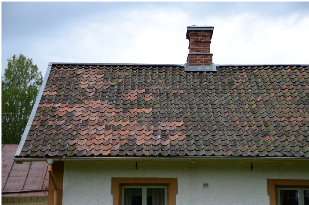
Del av tak efter omläggning, Vlm_kmoLS-1983