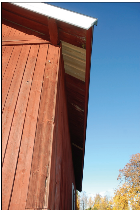
Lagning i takfot på östra takfallet, samt ny vindskiva på södra gaveln.