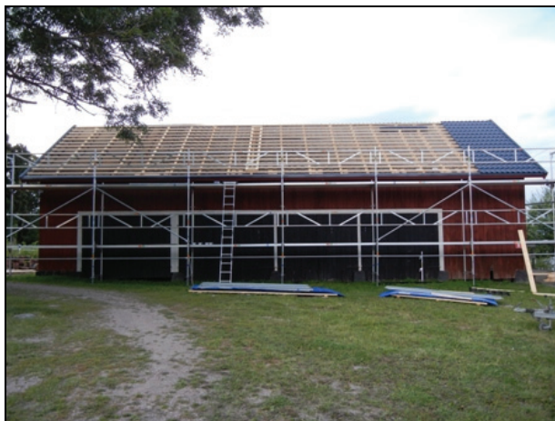
Västra takfallet under renovering.