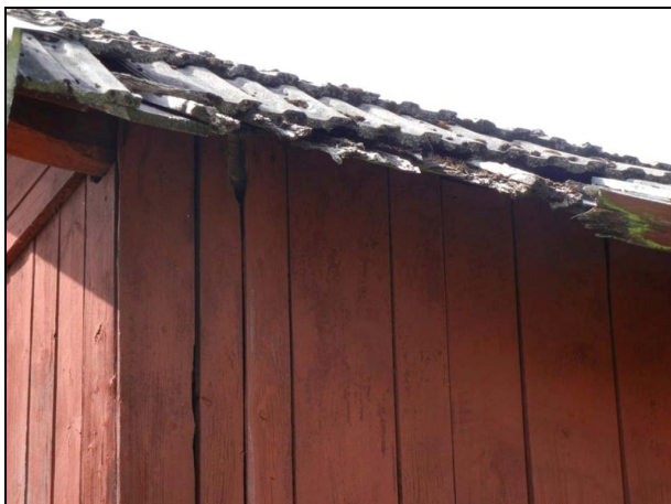
Skada i sydöstra hörnet.