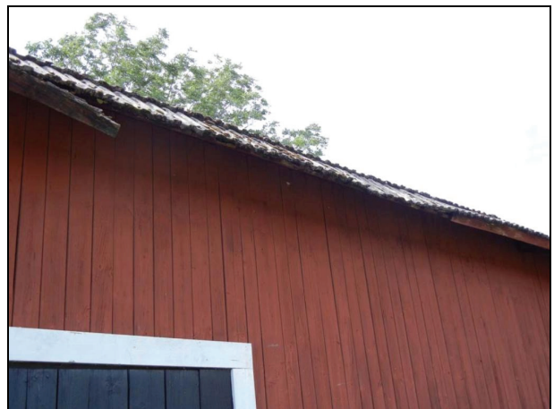
Skada i östra takfoten.