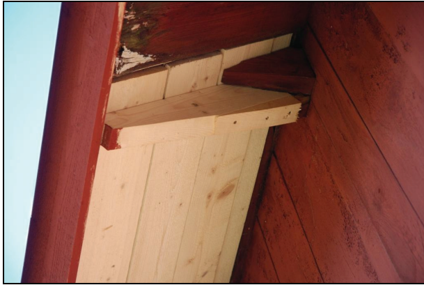
Underdimensionerad taktass, skarv fästad med skruv. Underbrädningen lagd i takets längdriktning istället för i fallriktningen.