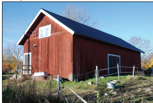
Byggnaden från sydöst efter renovering.