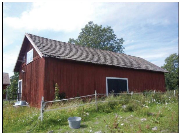
Byggnaden från sydöst innan renovering.