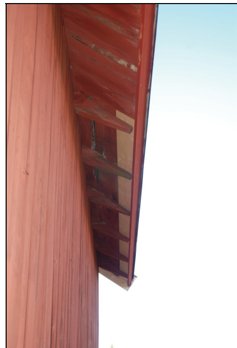
Lagning i takfot på östra takfallet.