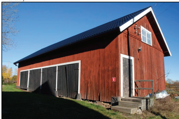
Byggnaden från sydväst efter renovering.