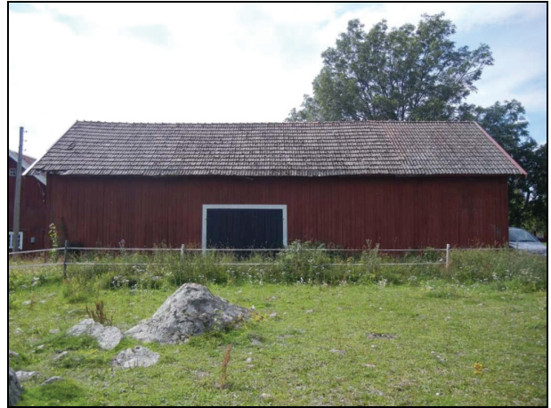
Byggnaden från öster innan renovering.