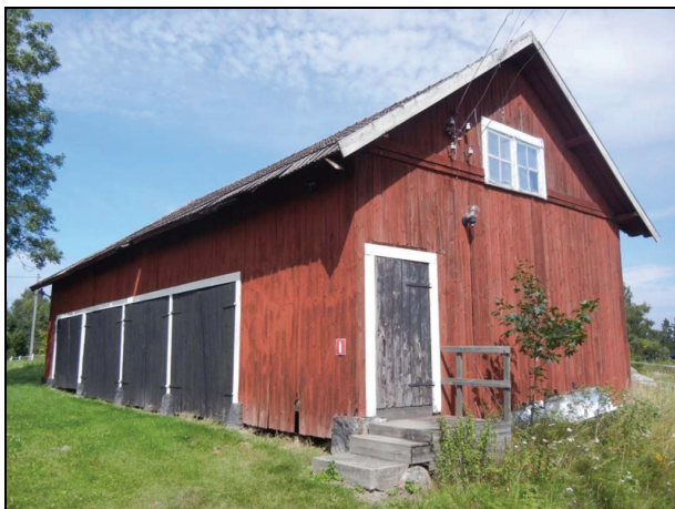
Byggnaden från sydväst innan renovering.