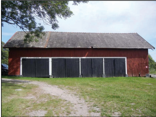
Byggnaden från väster innan renovering.

Byggnadens tak var i dåligt skick med rötskador i underbrädning, i synnerhet i takfot, skadade taktegel, skadade fotbräder och i viss mån skadat virke i takstomme.