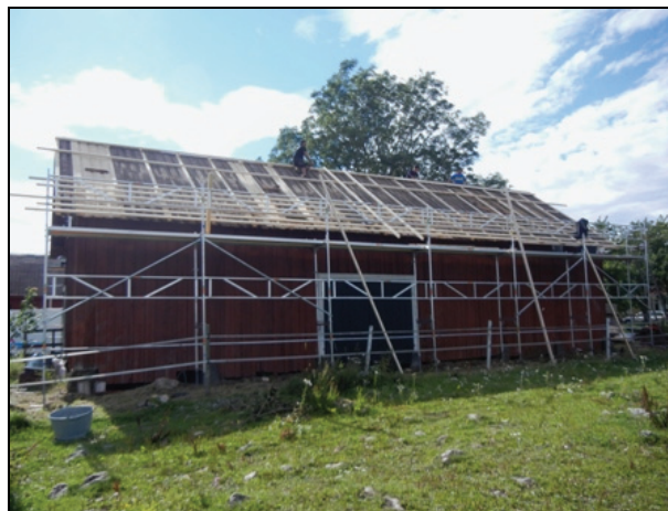
Östra takfallet under renovering.