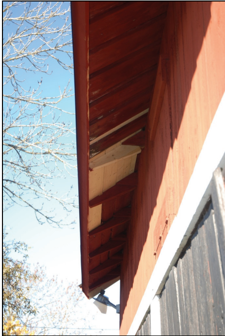
Lagning i takfot på västra takfallet.