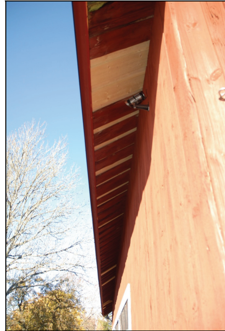
Lagning i takfot på västra takfallet.