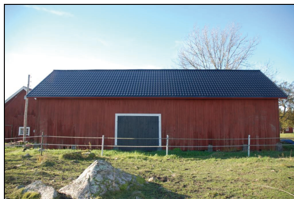
Byggnaden från öster efter renovering.