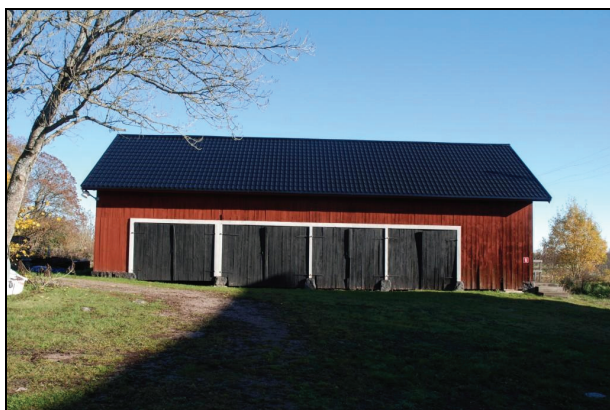
Byggnaden från väster efter renovering.

Arbetet innefattade byte av rötskadade delar av undertak, nytt yttertak av svart plegel, ny takfot och nya vindskivor.