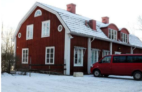
Byggnadens norra fasad. Fotonr. Vlm_kmvAB-059