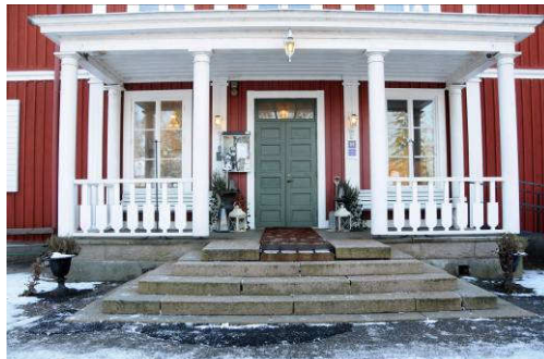
Verandan på den norra fasaden. Fotonr. Vlm_kmvAB-051