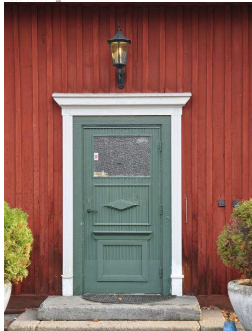
Entrédörr. Fotonr. Vlm_kmvFE-899