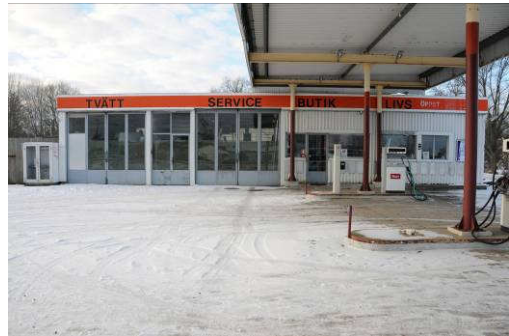
Bensinstationens norra fasad. Fotonr. Vlm_kmvAB-019