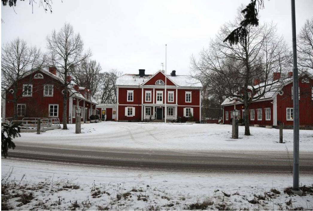
Gården från norr. Fotonr. Vlm_kmvAB-043