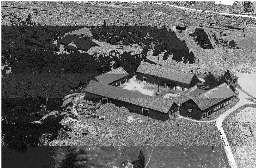
Bild 2. Flygfoto från 1940-talet över gästgivaregården och ekonomibyggnader. 7

Förmodligen etablerades gästgivaregården under sen medeltid. Gården har sedan dess förändrats kraftigt. Gården har under årens lopp både inrymt gästgiveri och fungerat som tingshus. Gården har också bedrivit jordbruk, spåren av detta är idag helt borta. Tidigare var området kring dagen gästgivargård bebyggd med ett flertal ekonomibyggnader. Några av dessa stod kvar in på 1960-talet, men revs troligen när området öster om gården exploaterades för industriverksamhet.