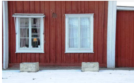
Närbild på norra fasaden, fallande bredder i panelen. Fotonr. Vlm_kmvAB-065