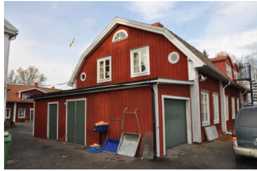
Byggnadens södra fasad. Fotonr. Vlm_kmvFE-885