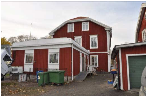
Byggnadens östra fasad med det tillbyggda köket. Fotonr. Vlm_kmvFE-886