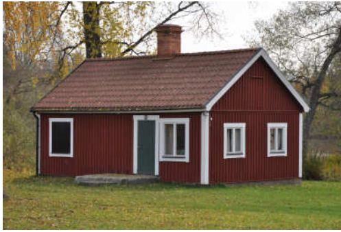
Bastuns norra och västra fasad. Fotonr. Vlm_kmvFE-879