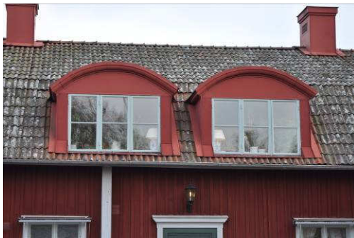
Byggnadens takkupor mot väster. Fotonr. Vlm_kmvFE-895