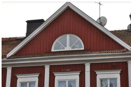
Halvcirkelformat fönster i frontonen mot norr. Fotonr. Vlm_kmvFE-892