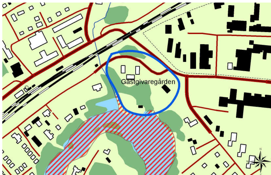
Bild 1 Karta över aktuellt område. Riksintresseområdet Strömsholms kanalmiljö är skrafferat med rött. Området som är aktuellt för denna rapport är inringat med blå markering. Utdrag ur digitala fastighetskartan från 2004, skala 1:5000.

Undersökningen omfattades av en fotodokumentation och översiktlig byggnadsinventering samt identifiering av kulturhistoriska värden. Undersökningen har också innefattat arkiv- och litteraturstudier i tillgängligt material. Rapporten inleder med att ta upp en nulägesbeskrivning över områdets betydelse för kulturmiljövården, framförallt gällande närheten till riksintresset Strömsholms kanalmiljö och i kulturminnesvårdsprogram. Därefter presenteras områdets historik och avslutningsvis beskrivs aktuella byggnader utifrån deras exteriör och deras kulturhistoriska värden. För detaljbilder av byggnaderna, se bildbilaga.