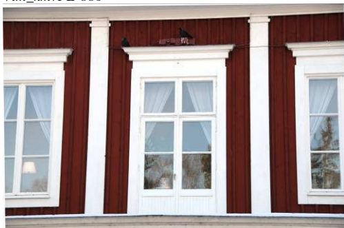
Balkongdörr över verandan. Fotonr. Vlm_kmvAB-054