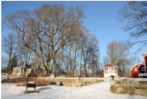
Trädgården söder om gästgivargården med lövträd och en nyligen tillagd stenterass. Fotonr. Vlm_kmvAB-077