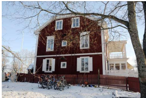
Byggnadens västra gavel. Fotonr. Vlm_kmvAB-071