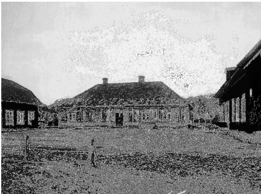
Bild 4. Avfotografering av foto som hänger idag hänger i gästgivaregården huvudbyggnad. Bilden är troligen spegelvänd på grund av tidens fototeknik. Originalbilden är tagen i slutet av 1800-talet och visar den tidigare huvudbyggnaden på platsen. 10

Den byggnad som tidigare låg på platsen uppfördes troligen i 1700-talets början. Från denna byggnadsfas finns idag endast den västra flygeln kvar. I den nuvarande byggnaden hänger ett fotografi från slutet av 1800-talet, av den tidigare byggnaden. Troligen är fotot spegelvänt till följd av tidens fototeknik. I bildens högra del mellan huvud- och flygelbyggnaden syns taket på en byggnad som i kartmaterialet borde stå på huvudbyggnadens vänstra sida (se bild 4).