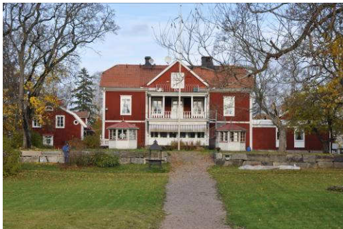
Gästgiveriet från söder, höstbild. Fotonr. Vlm_kmvFE-880