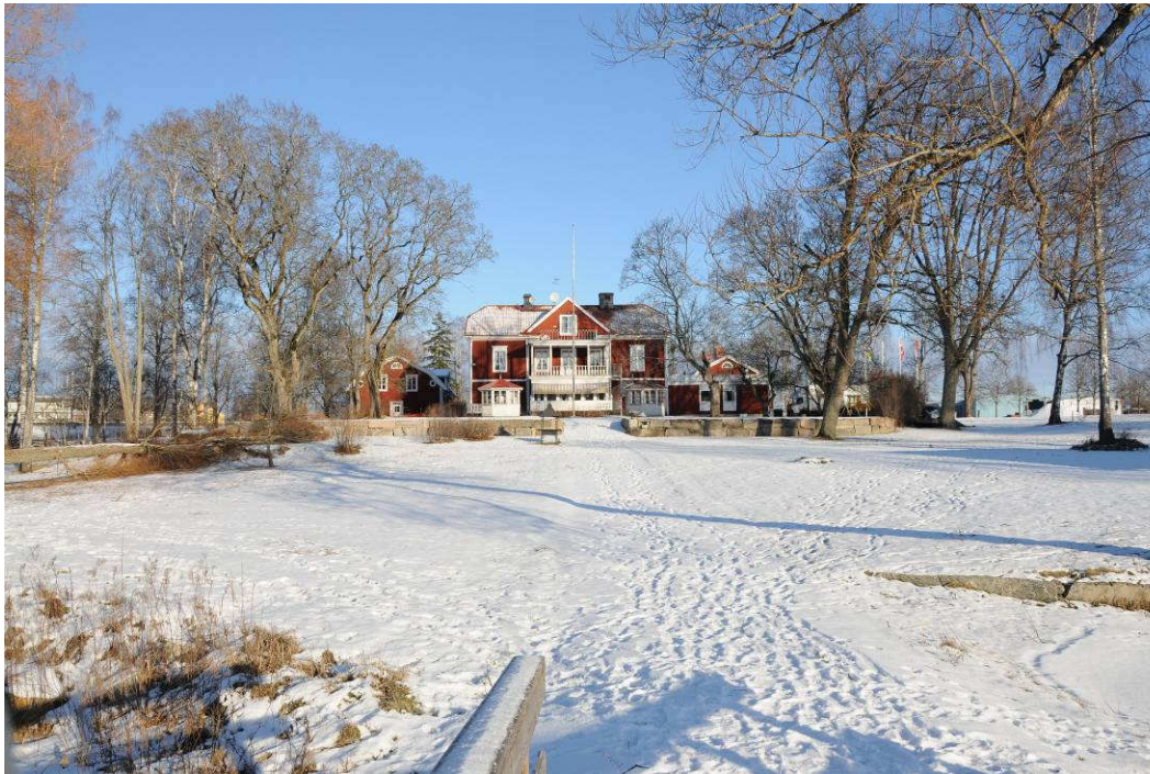
Miljön söder om gästgivaregården har parkkaraktär med stora lövträd och öppna ytor. Fotonr. Vlm_kmvAB-085