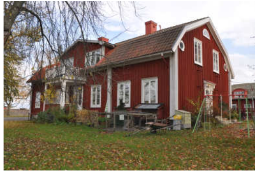
Byggnadens västra fasad. Fotonr. Vlm_kmvFE-872