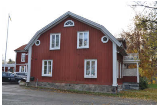
Byggnadens norra fasad. Fotonr. Vlm_kmvFE-870