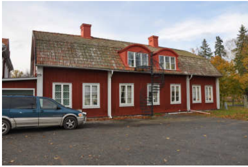
Byggnadens östra fasad. Fotonr. Vlm_kmvFE-887