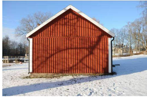
Östra fasaden. Fotonr. Vlm_kmvAB-082