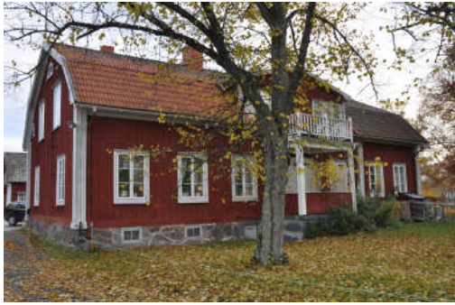
Byggnadens västra fasad. Fotonr. Vlm_kmvFE-871