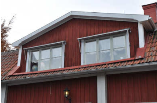
Byggnadens takkupa mot öster. Fotonr. Vlm_kmvFE-896