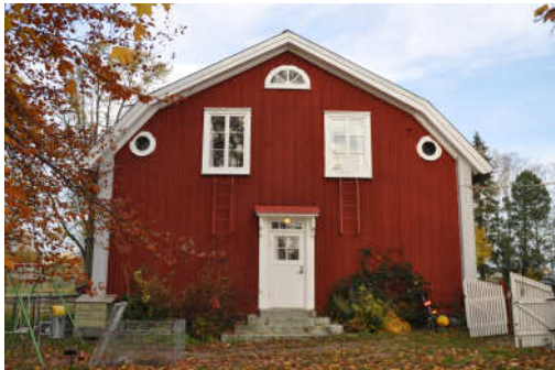
Byggnadens södra fasad. Fotonr. Vlm_kmvFE-874