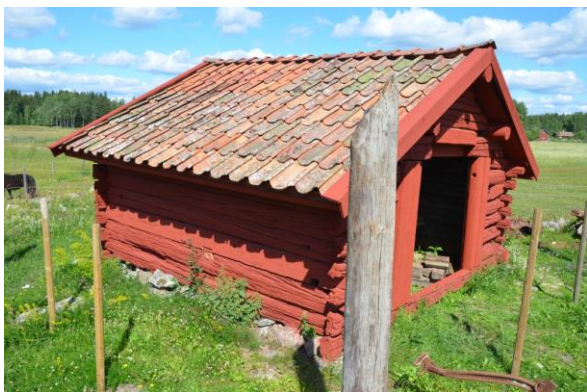
Hela byggnaden målades med röd slamfärg.