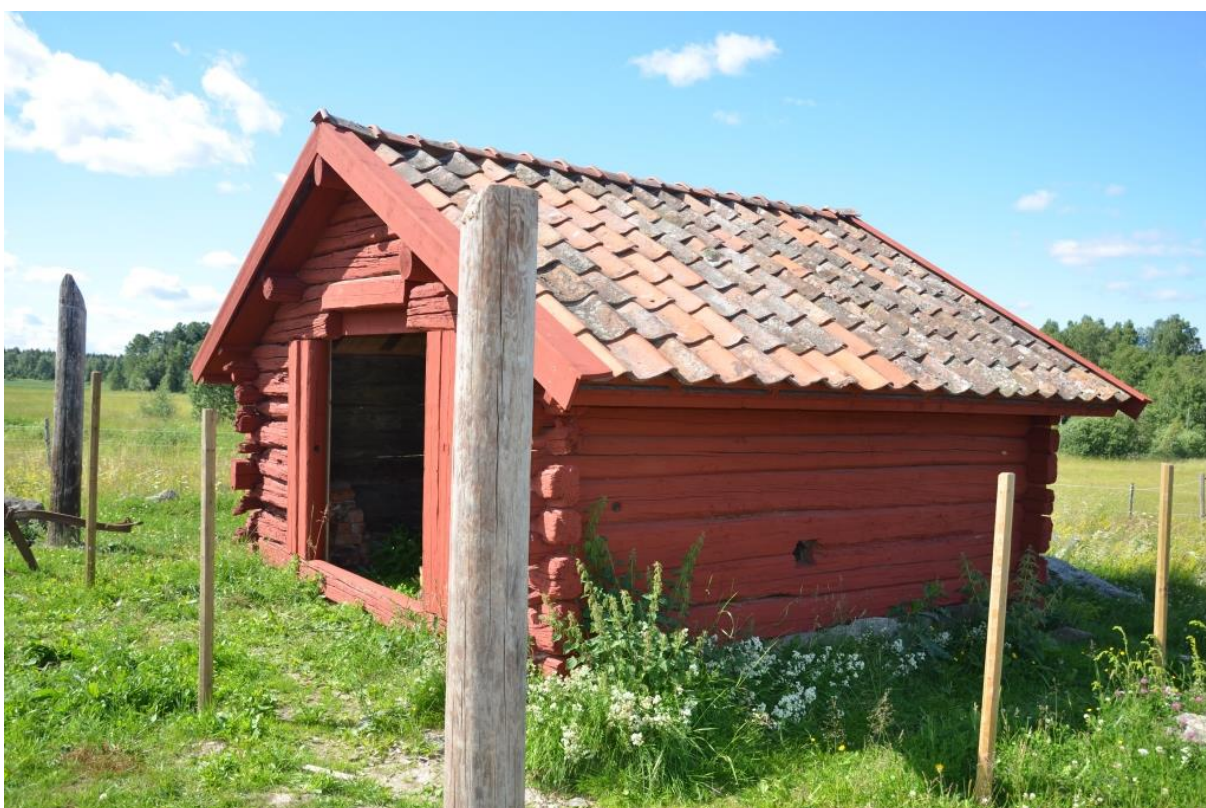
Byggnaden är viktig för intrycket av det öppna odlingslandskapet.