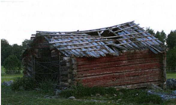
Smedjans förfallna skick innan åtgärderna.