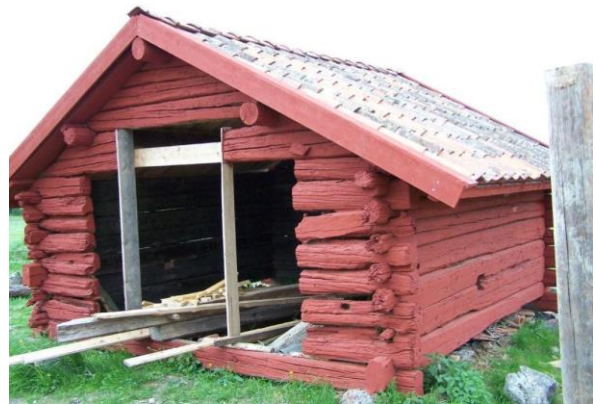
Pågående åtgärder av port.