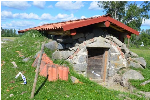
Eftergenomföda åtgärder, sten har lagts tillbaka över valvet. Foto: Vlm_kmvFE-3254.