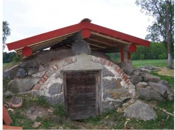
Jordkällarens takkonstruktion under arbetets gång.