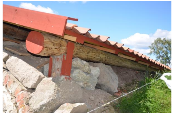
Åsarna vilar på stolpar. Foto: Vlm_kmvFE-3256.