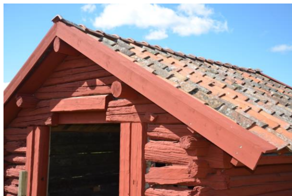
Vindskivor och täckbrädor målades röda. Foto: Vlm_kmvFE-3251