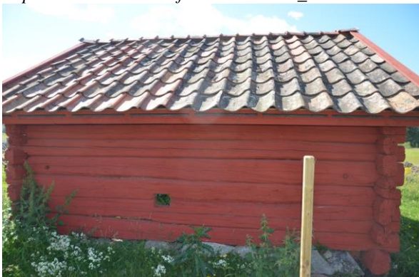
1-kupigt tegel och täckbrädor av trä lades på byggnaden. Foto: Vlm_kmvFE-3249