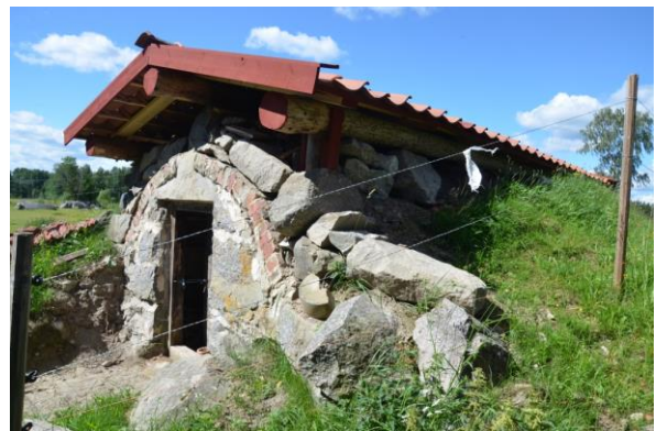
Jordkällaren efter åtgärderna.