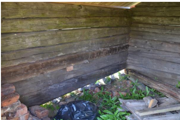
Reparerade stockar inifrån.