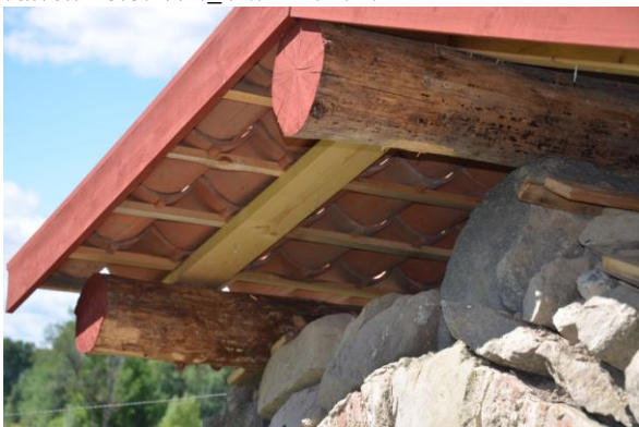
Ny grov ströläkt spikades innan bärläkten spikades på.