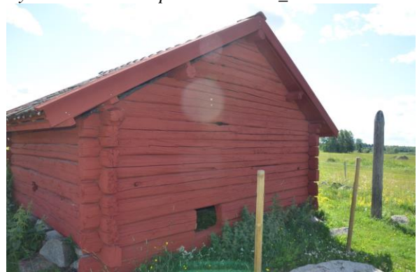
Baksidan av smedjan.