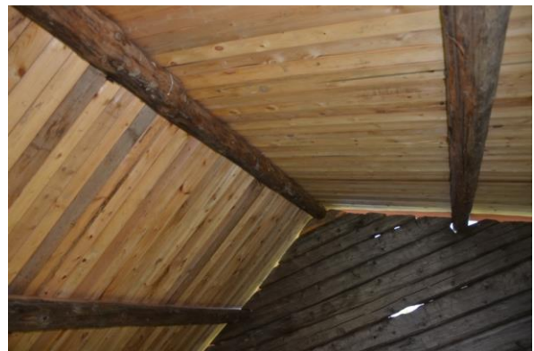
Nytt undertak av råspont.