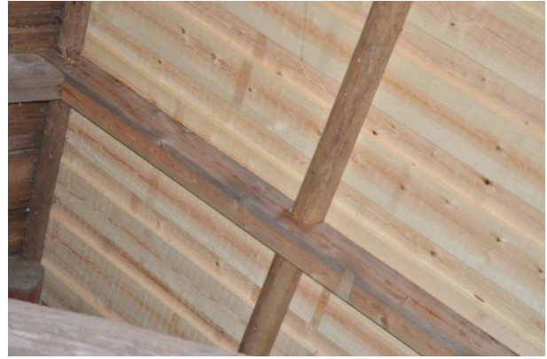
Reparation av takstol som undertak. Vlm_kmvFE-3842