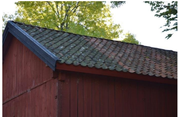
1-kupigt tegel ligger på baksidan och kompletterades med begagnat tegel. Vlm_kmvFE-3861