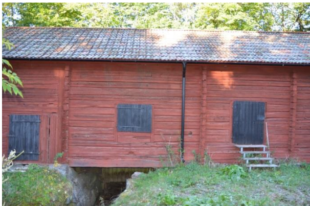
Ladugården efter åtgärderna. Under byggnaden leds ett vattendrag. Vlm_kmvFE-3857