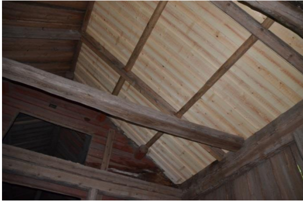
Delar av undertaket reparerades med ny råspont. Vlm_kmvFE-3841