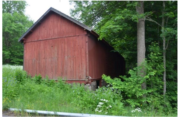
Ladugården är byggd i en slutning med en kraftig mur. Vlm_kmvFE-3171