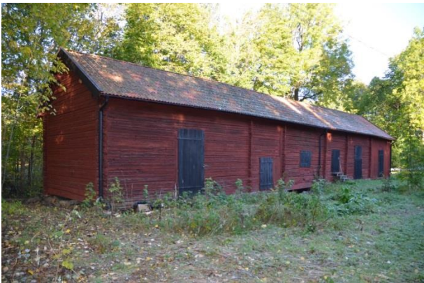
Ladugården efter åtgärderna. Vlm_kmvFE-3856