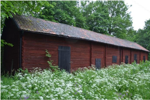
Ladugården före åtgärderna. Vlm_kmvFE-3168