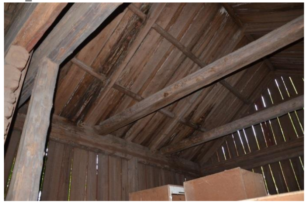
Delar av undertaket var rötskadat. Vlm_kmvFE-3162