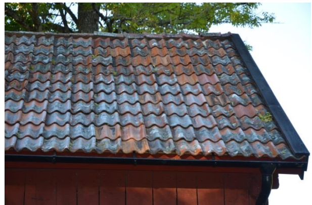
Mot gårdsplanen lades 2-kupigt tegel likt befintligt. Komplettering skedde med begagnat tegel. Vlm_kmvFE-3849