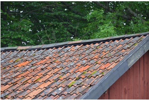
Tegeltaket böljar och tegelpannor glipar. Vlm_kmvFE-3170