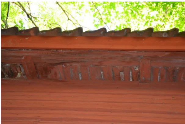
Ny takfotsbräda. Vlm_kmvFE-3846