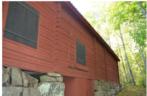
Baksidan ut mot skogen. Vlm_kmvFE-3845