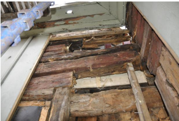
Överst: Vlm_kmvIM-2328, underst: Vlm_kmvIM-2334, Höger: Vlm_kmvIM-2332