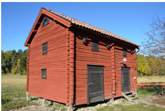
Magasinet efter åtgärder, Vlm_kmvSB-854.