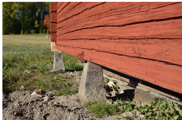
Nybytt syllstock på västra sidan, Vlm_kmvSB-85. Uppresta stenplintar, Vlm_kmvSB-849