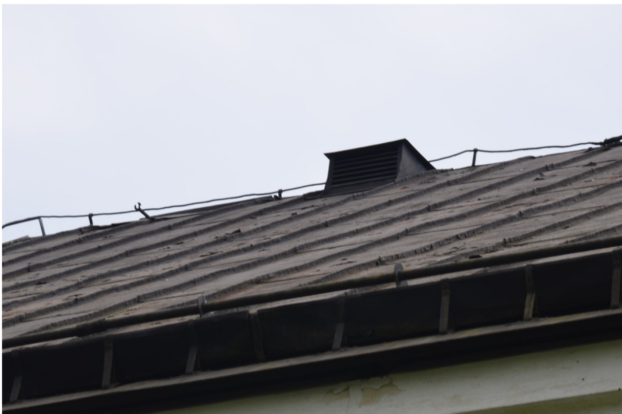
Skeppstaket med flagande färg innan ommålning. Vlm_kmvFE-2853