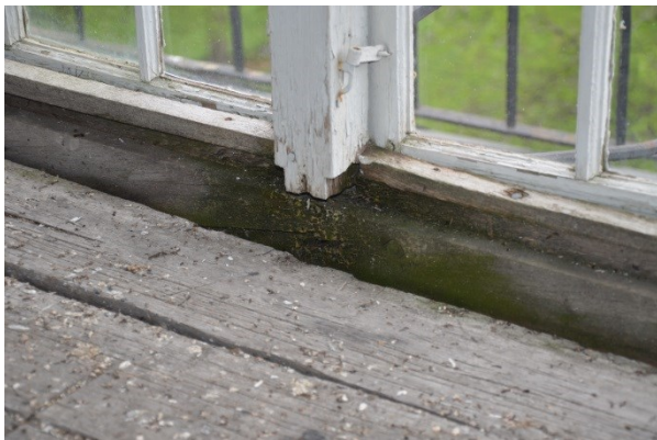
Fönsterbåge i tornlanterninen innan åtgärder Vlm_kmvFE-2842

Tornlanterninens fönster kittades och målades om i kulör och utförande likt befintligt. Fönstren skrapades och målades med linoljefärg. Vindskivorna behandlades på likanade sätt. På den östra gaveln, fasaden över koret hade fläckar och andra putsskador. Dessa åtgärdades med material och utförande likt befintligt. Kalkbruk användes för åtgärderna.