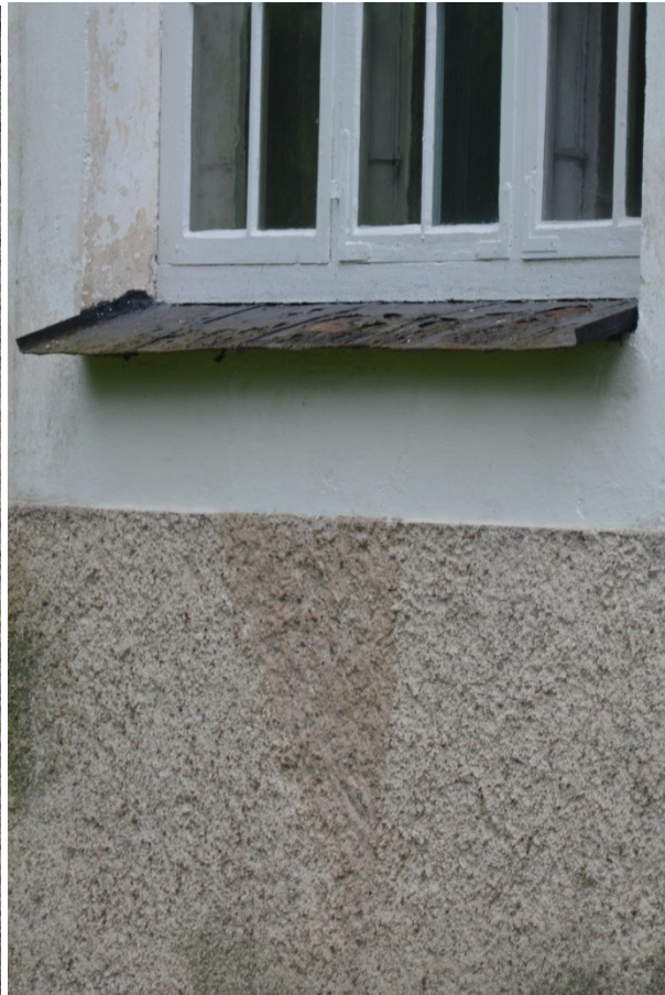
Solbänk innan målning. Vlm_kmvFE-3091