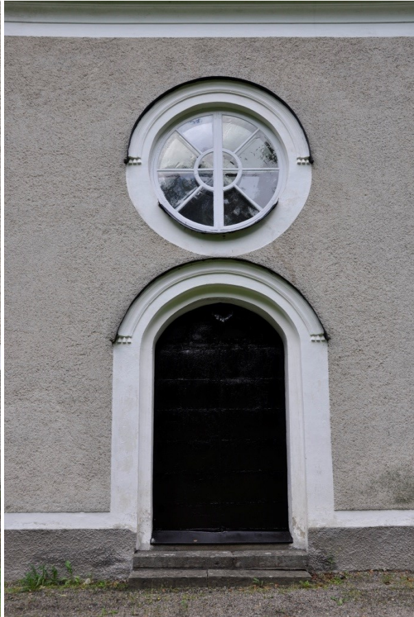
Dörr i södra fasaden efter målning. Vlm_kmvSB-1978