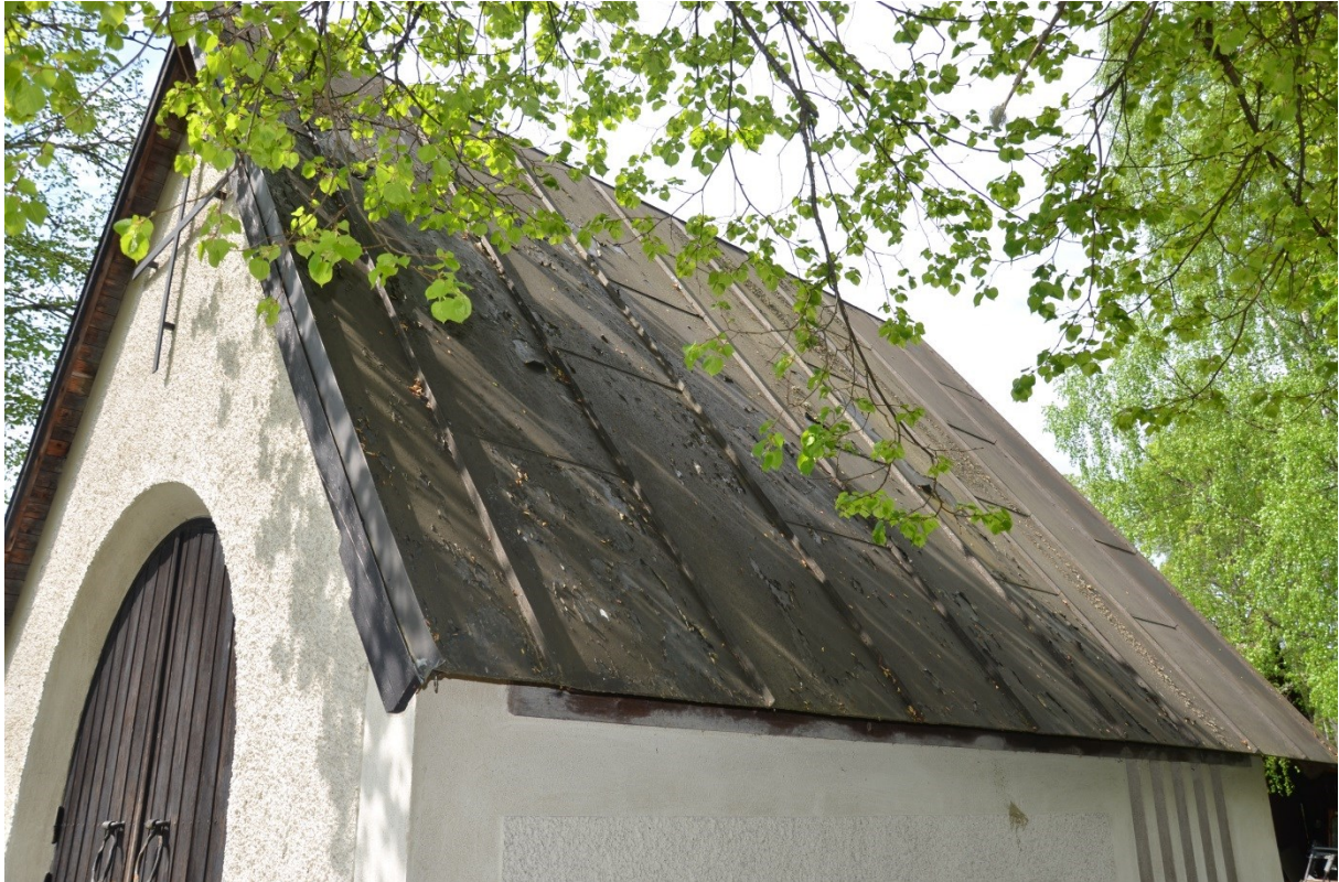
Bisättningshuset plåttak innan målning. Vlm_kmvFE-2855