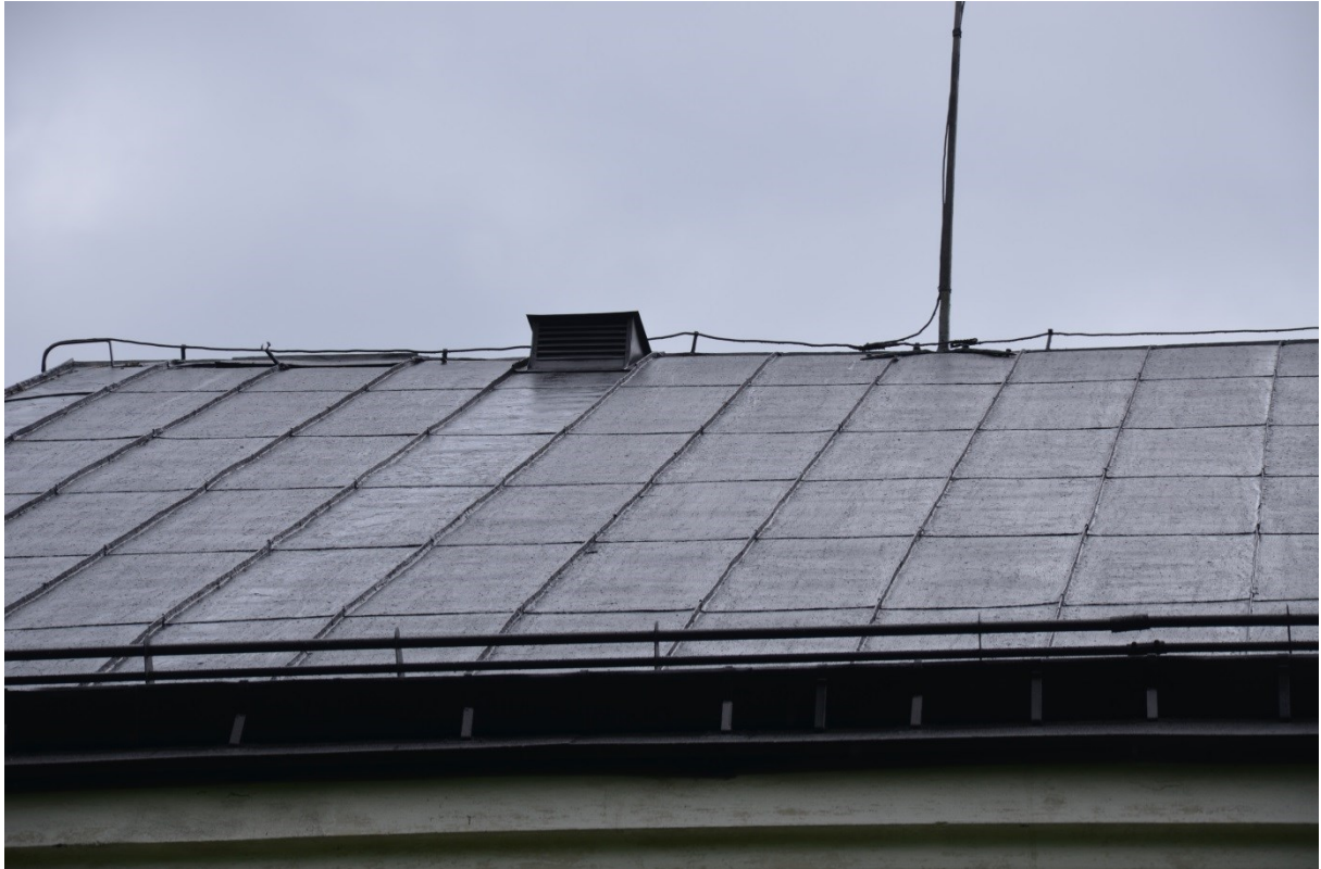
Skeppstaket efter målning. Vlm_kmvFE-3084