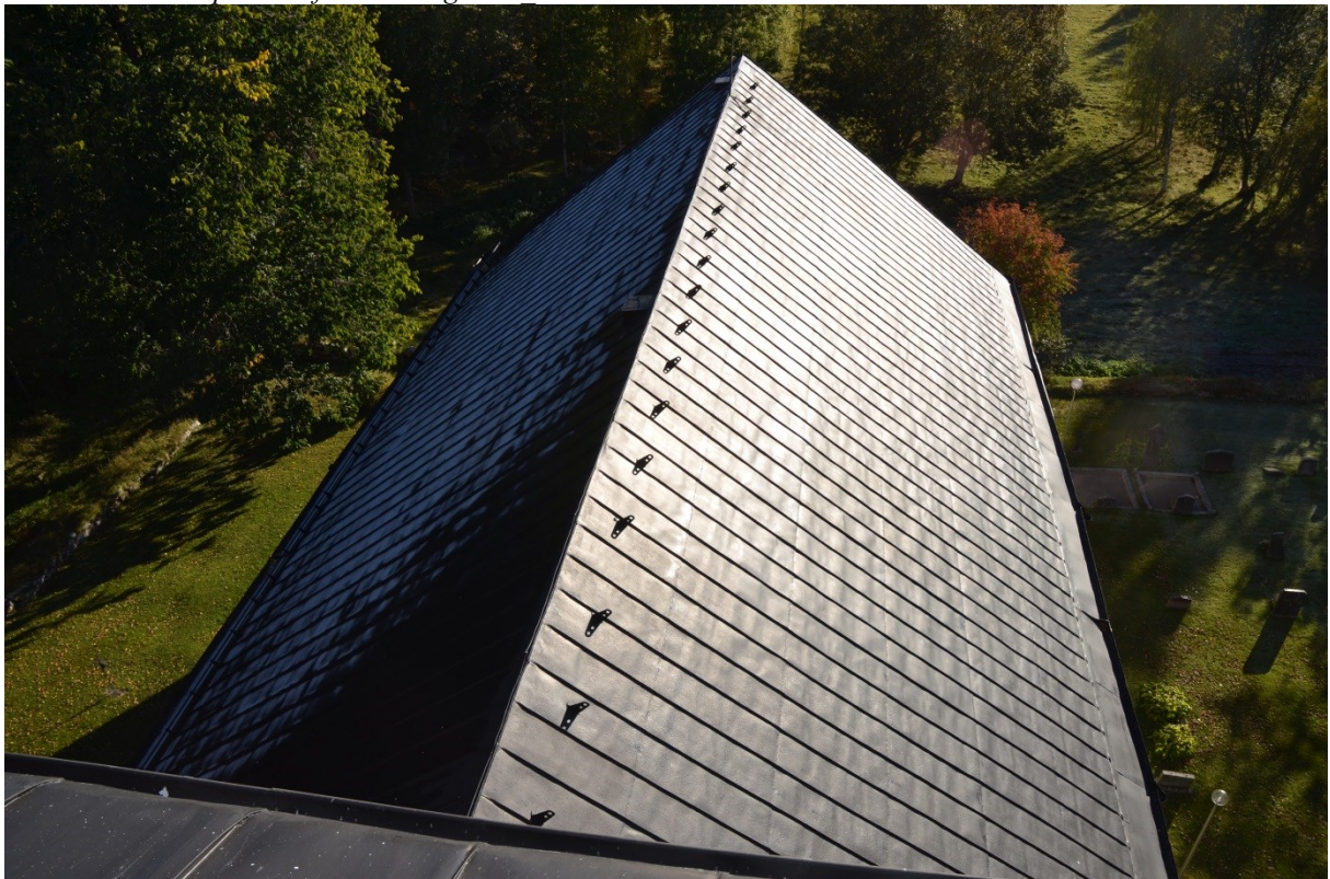
Skeppstaket efter målningsarbeten. På takfallet till vänster i bild syns frost som ännu inte försvunnit i solen. Vlm kmvFE-3901