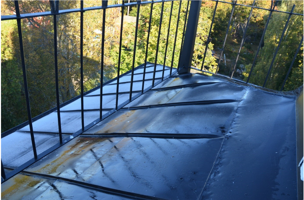
Tornlanterninens plåttak efter målning. Vlm kmvFE-3897