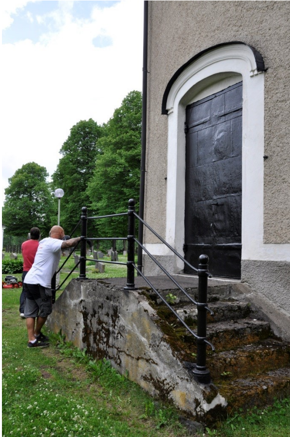
Sakristians dörr och smidesräcke efter målning Vlm_kmvSB-1981