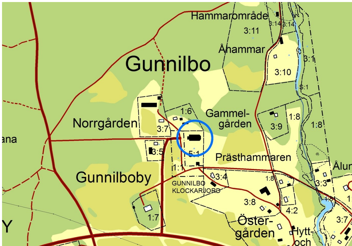
Karta över området kring Gunnilbo kyrka. Kyrkobyggnaden är markerad med blå ring. Utdrag ur digitala fastighetskartan från 2004, skala 1:6000.

Västmanlands läns museum fick uppdraget som antikvarisk expert i ärendet. Antikvarisk medverkan har utförts av byggnadsantikvarie Fredrik Ehltun, som även sammanställt denna rapport. Arbetena genomfördes under sommaren 2013.