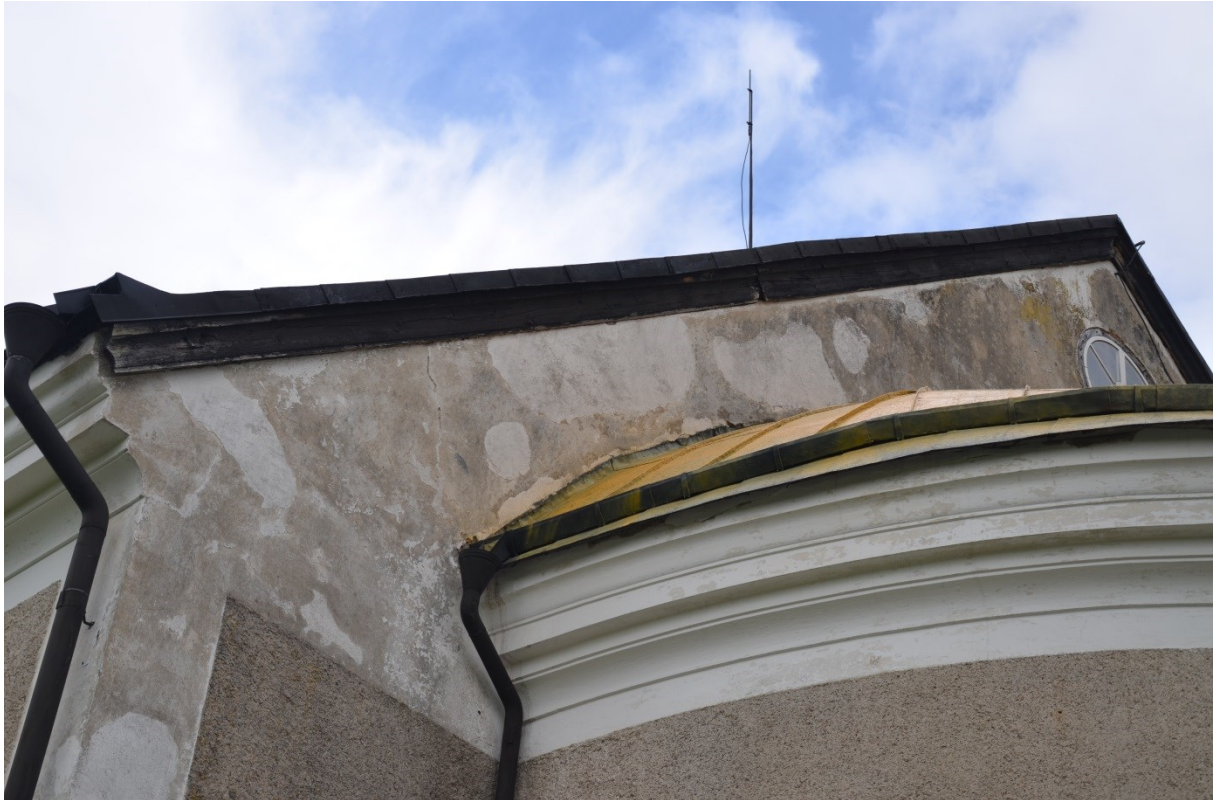
Vinsskivorna och fasadens puts innan åtgärdernas genomförande. Kortaket är grundmålat vid fototillfället. Vlm_kmvFE-3079