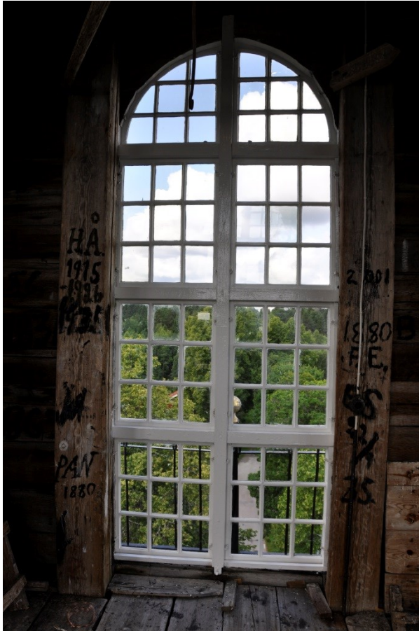
Tornlanterninens fönster efter åtgärder Vlm_kmvSB-1969