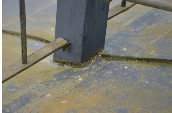
Algpåväxt på plåten på tornlanterninen. Vlm_kmvFE-2834