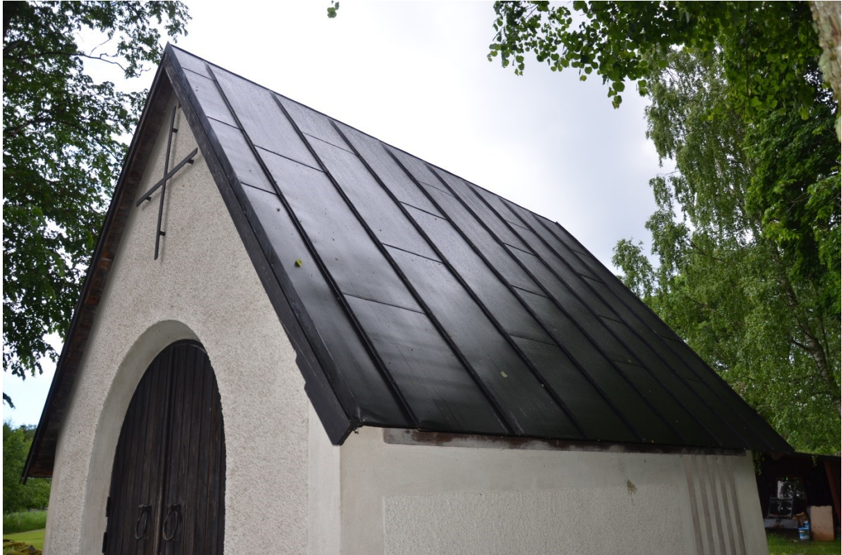
Bisättningshuset efter takom målning. Vlm_kmvFE-3883