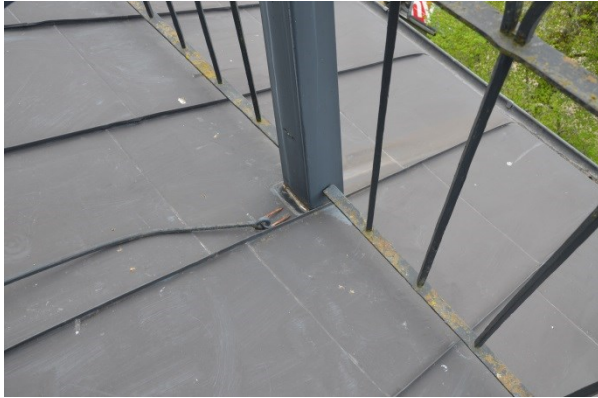
Tornlanterninens plåttak innan målning. Vlm_kmvFE-2832