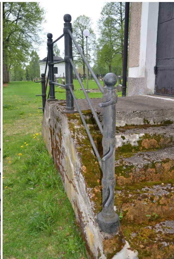
Smidesräcket vid sakristian. Vlm_kmvFE-2851