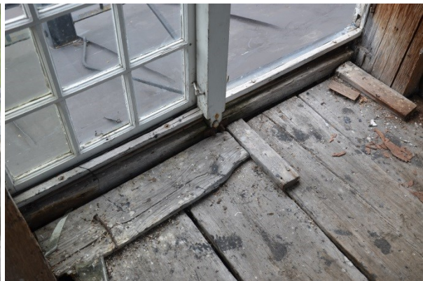
Fönster innan åtgärderna. Vlm_kmvFE-2843