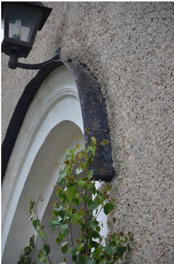
Dropplista ovanför huvudentréns dörr, innan målning. Vlm_kmvFE-3072