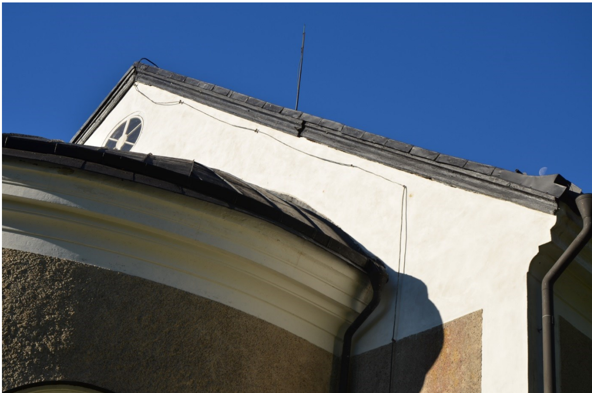
Östra fasadens puts och vindskivor efter genomförda åtgärder. Vlm_kmvFE-3888