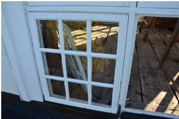
Ett av fönstren i tornlanterninen efter omkittning Vlm_kmvFE-3905