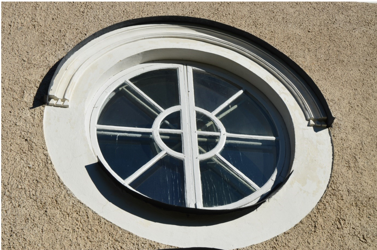
Runt fönster ovanför dörr i södra fasaden med nymålade plåtdetaljer. Vlm_kmvFE-3915