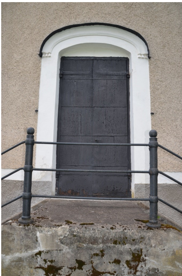
Sakristians dörr och smidesräcke. Vlm_kmvFE-2849