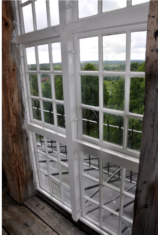
Nymålat fönster i tornlanterninen Vlm_kmvSB-1956