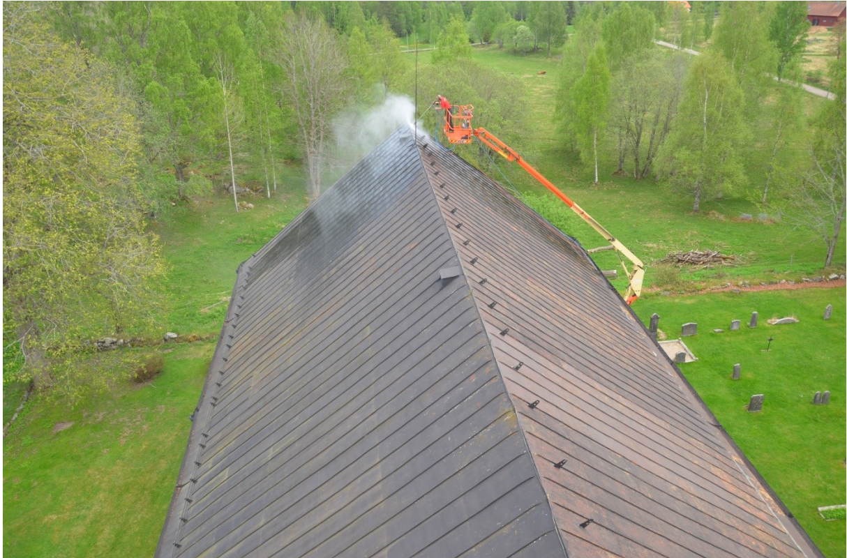
Skepptaket under arbetet med vattenblästringen, på de redan rengjorda ytorna syns rostfläckar. Vlm_kmvFE-2837