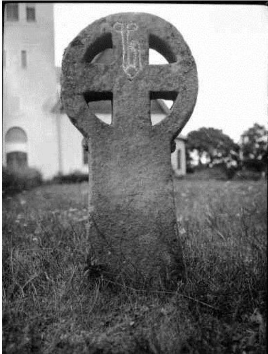
Bild 2. Medeltida hjulkors från Järsnärs kyrka, Jönköping län.

Under 1600- och 1700-talen fortsatte man att främst använda kalk- och sandsten som material för gravvårdar, men i flera bruksområden blir smidesjärn och gjutjärn vanliga material. Som under medeltiden är de flesta bevarade vårdarna från rika familjer, så det är de övre skiktens minnesmärken vi har kunskap om. De är över lag större, mera påkostade och rikare dekorerade än de medeltida.