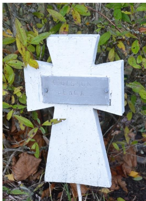
Bild 15. Exempel på gravvård från allmänna linjen. Gravvård från 1936, Möklinta kyrkogård, kvarter D. Gravvården är ett av de vita korsen som ofta användes under denna tiden. Innan dessa användes enkla trästickor. Bild-ID Vlm_mökSB-432.jpg

Samtliga gravar tillhörande allmänna linjen i kvarter D och det fattiga området i kvarter C har bedömts som kulturhistoriskt värdefulla. Dessa har höga samhällshistoriska värden då de är resta över personer som ofta försvinner från historien. Deras värden förstärks genom gruppsamverkan och hur de är placerade på kyrkogården.