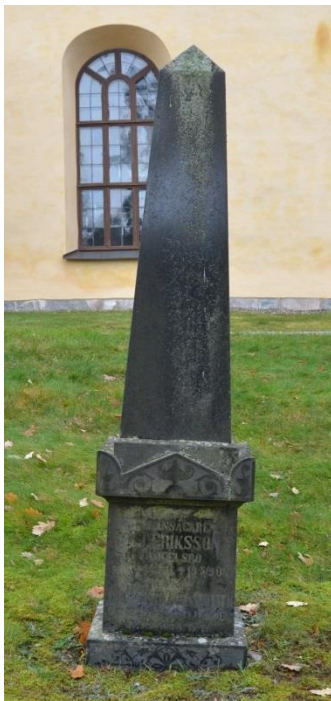
Bild 4. Gravvård från 1907. Typisk för sekelskiftet med hög obeliskform i svart granit. Bild-ID Vlm_mökSB-304.jpg

1990 års begravningslag överförde bestämmanderätten över gravvårdarnas utformning till gravrättsinnehavaren så länge man håller sig inom ”god gravkultur” (Begravningslagen (1990:1144) kap 7 26 §). Lagändringen har inneburit att vi från och med 1990-talet har vi fått mera individualistiskt formade gravvårdar.