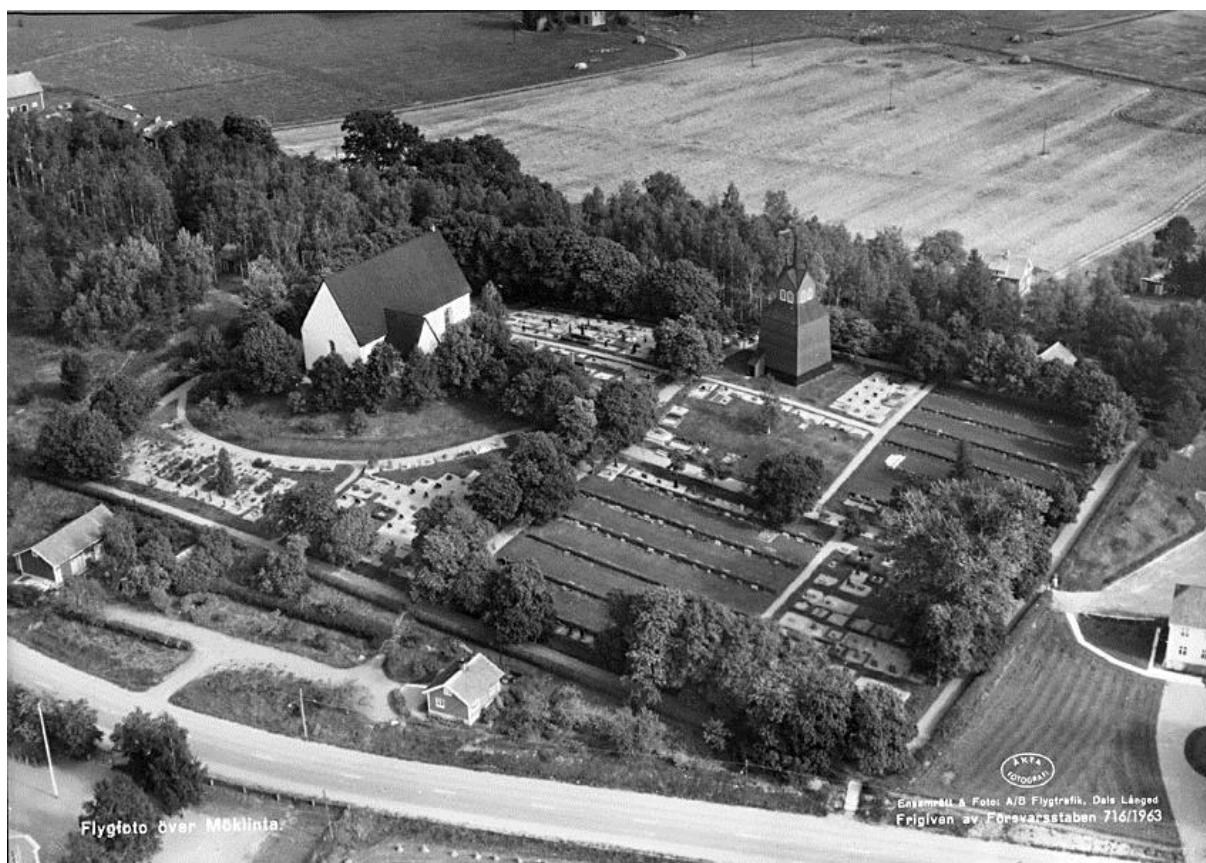
Bild 7. Flygfoto över Möklinta kyrkogård från 1963. De vita partierna är grusgravar.

Från någon gång kring sekelskiftet och åtminstone en bit in på 1930-talet var de flesta nya gravar på kyrkogården grusgravar. En flygbild från 1948 visar att grusgravarna dominerade kyrkogården, och flera av kvarteren var uteslutande grusbelagda. En flygbild från 1963 (bild 7) visar att kvarter AB och H har fått till stor del heltäckande gräsmatta. Under 1960-talet försvann resten av grusgravarna förutom en som sparades i kvarter G, nära kyrkan.