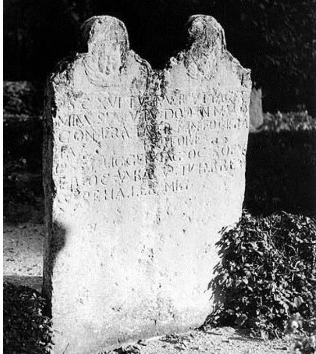
Bild 3. Äldre gravvårdar, trol. sekelskifte 1600- 1700-tal. Dannäs kyrka, Jönköping län.

Under 1800-talet växte Sveriges befolkning explosionsartat, särskilt i städerna. Med befolkningsväxten kom problemet med överfyllda kyrkogårdar. Mot 1800-talets slut blev det allt vanligare att anlägga nya begravningsplatser utanför stadsgränsen. Nya ideal och riktlinjer för begravningsplatser gjorde att de fick det parklika utseendet vi ser idag. Trädplanteringen fortsatte, nu enligt lag, och trädkranser och prydliga alléer växte fram. Gravarna lades i regelbundna kvarter, avskilda med gångar. Kring sekelskiftet 1800-1900 nådde dessa idéer även landsbygdens kyrkogårdar, och de flesta genomgick gestaltungsreformer med trädplantering och prydlig kvartersindelning. Många utvidgades för att ge plats för den växande befolkningen.