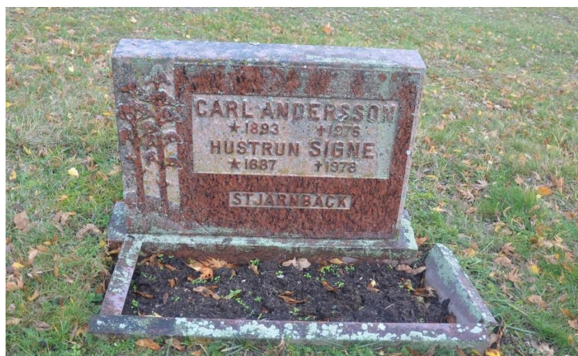
Bild 5. Gravvård från 1976. Typisk för 1970-talet med låg, bred form i röd granit. Bild-ID Vlm_mökEHW-470.jpg