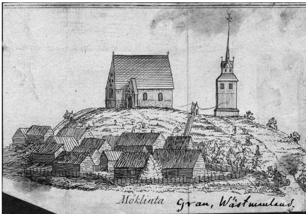
Bild 6. Olof Graus gravyr över Möklinta kyrka och kyrkogård, 1754. På bilden syns bogårdsmuren med stigluckorna. Klockstapeln stod utanför kyrkogården.

Kyrkogården är troligen samtida med den första kyrkan på platsen. Kyrkogården var förr omringad av en medeltida bogårdsmur (bild 6) som enligt sockenborna ska ha varit ”dubbelt högre, än sådana murar pläga vara”. 7 Bogårdsmuren hade brädtak, och på äldre kartor kan man se att den hade fyra stigluckor, en i varje väderstreck. Muren och stigluckorna revs vid 1890 års utvidgning av kyrkogården.