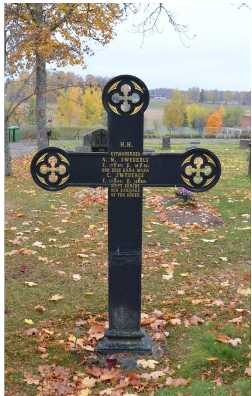
Bild 10. Exempel på gravanordning av järn. Gravvård från 1860-talet, Möklinta kyrkogård, kvarter A. Ett av få järnkors på kyrkogården, dessutom en av de äldsta gravvårdarna. Bild-ID Vlm_mökEHW-49.jpg

Eftersom det inte har funnits järnbruk i Möklinta socken har det heller inte funnits en tradition för järnkors på kyrkogården. Det finns dock några exempel på sådana, och dessa har bedömts som mycket kulturhistoriskt värdefulla. De utgör en försvinnande liten rest av en unik konstruktionsperiod på kyrkogårdarna och har således högt teknikhistoriskt värde.