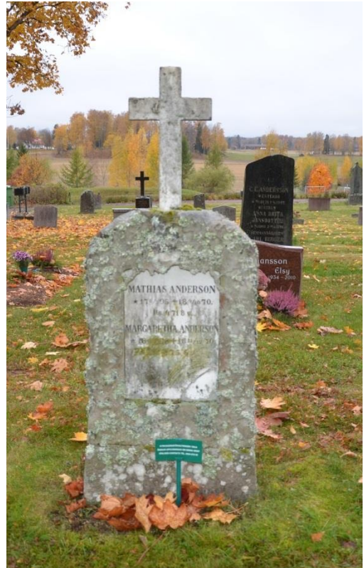
Bild 9. Exempel på gravvård från före 1900. Gravvård från 1870, Möklinta kyrkogård, kvarter A. Ekbladen uthuggna i sandsten med en marmorplatta på mitten och ett krönande kors var typiska gravvårdselement kring 1870. Gravvården har idag ett unikt estetiskt och konstnärligt uttryck på Möklinta kyrkogård och är en av kyrkogårdens äldsta. Bild-ID Vlm_mökEHW-51.jpg

På Möklinta kyrkogård finns det inga bevarade gravanordningar från före 1850; den äldsta är från 1860-talet. Sammanlagd finns det endast 13 gravar som är äldre än 1900. Vi har därför bedömt samtliga gravvårdar äldre än 1900 som mycket kulturhistoriskt värdefulla. De uppvisar ofta hög hantverksmässig kvalité och har både konstnärliga och hantverkshistoriska värden. Det att de är så få på kyrkogården gör dem dessutom unika och viktiga representanter för gravanordningar från en svunnen tid.