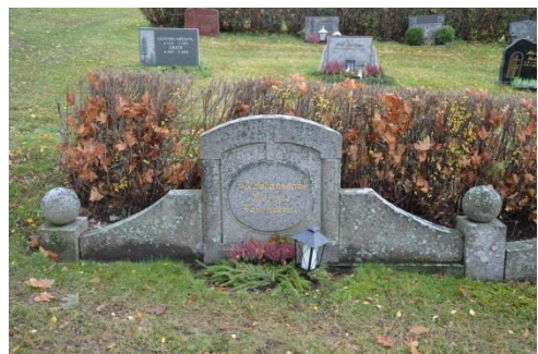
Bild 12 och 13. Exempel på gravvårdar som är representativa för sin tid. Gravvårdar från 1933 och 1947, Möklinta kyrkogård, kvarter D. Dessa två är sammanbyggda och har tidigare varit grusgravar. Det låga, breda utseendet är typiska för 1930- och 1940-talen då det kom nya regler om gravvårdarnas höjd. Det finns ytterligare två tvillinggravar bredvid dessa, och de är placerade nära allén. Deras gruppsamverkan och väl synliga placering ger dem pedagogiska, samhällshistoriska och miljöskapande värden som förstärker deras kulturhistoriska värde. Bild-ID Vlm_mökSB-314.jpg och -315.jpg.

I stort sett alla gravvårdar kan sägas vara representativa för sin tid, eftersom varje tid har sin smak, sina traditioner, sina regler om vårdarnas storlek. Vi har värderat några som kulturhistoriskt eller mycket kulturhistoriskt värdefulla. Dessa har då haft förstärkande värden som att de är konstnärligt utförda eller sällsynta på grund av hög ålder. Bland det tidiga 1900-talets höga gravar i polerat svart granit har vi till bedömd de som har stora kors eller är extra rikt dekorerade som kulturhistoriskt värdefulla.