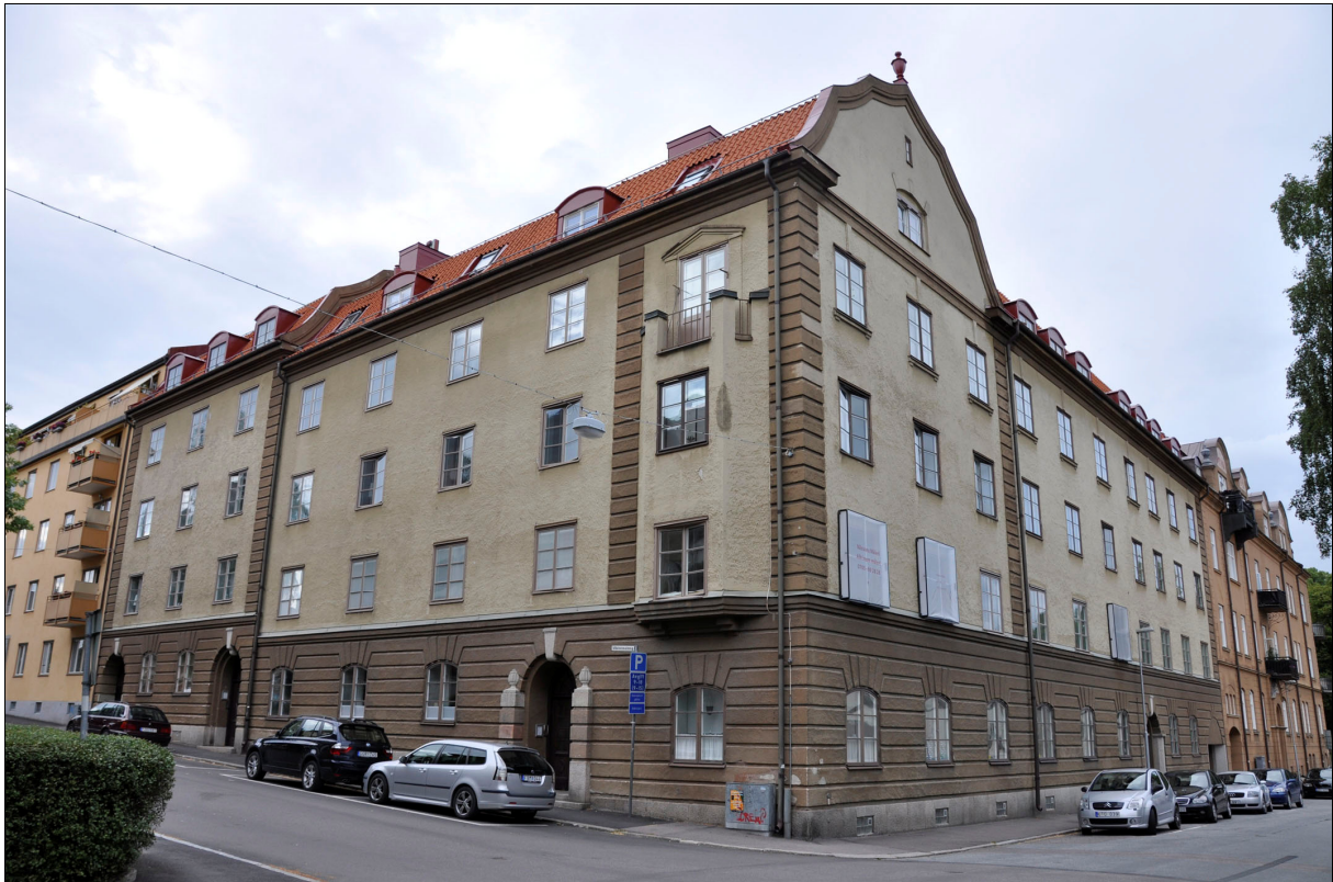
Bild 1: Byggnaden sträcker sig över hörnet i korsningen Källgatan och Västermalmsgatan. Etapp 1 av fönsterrestaureringen är avslutad och etapp 2 är påbörjad, därav de täckta fönstren till höger i bild.

Den aktuella byggnaden stod färdig 1921 i tegel i fyra våningar. Fasaden är putsad med rusticerad bottenvåning, lisener och hörnkedjor. Färgskalan är dov med slätputsade partier i beige medan de övriga är markerade med en brun kulör. Taket är brutet och täckt med enkupigt lertegel. Mot gatan finns omväxlande takkupor och takfönster, mot gården finns takkupor. Byggnaden präglas av en omsorg om detaljernas utformning, fasaden är relativt enkel med rusticeringen, takformen och portarna som dekorativa element. Fönstren ligger i liv med fasaden och är viktig del byggnadens uttryck. Fönstren är symmetriskt placerade i horisontella band på fasaden. De är av tvåluftstyp och fönsterbågarna är kopplade. I varje båg finns två spröjs och tre rutor med munblåst glas.