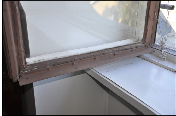
Bild 3: Vissa av fönsterbågarna hade en äldre skyddsplåt med spårskruv med rund skalle.