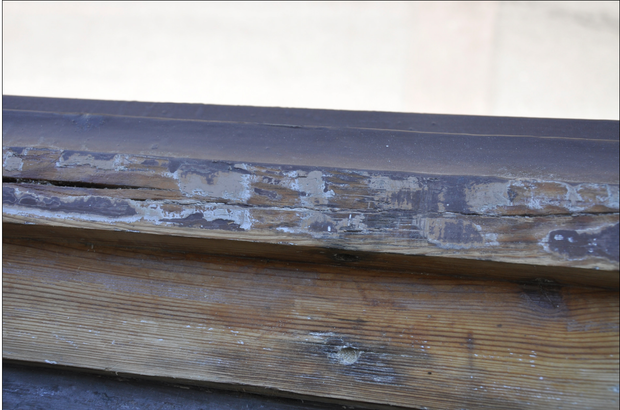
Bild 12: Vid skrapning på fönsterkarmen påträffades endast tre kulörer, en grå grundfärg, en äldre beige kulör och den befintliga bruna kulören.

All målning skedde med fabrikat Ottossons. Kulören var den äldre originalkulören som påträffades när fönsterbågarna skrapades. Exakt kulör togs fram av entreprenören, 50 % zinkvitt och 50 % bränd umbra.