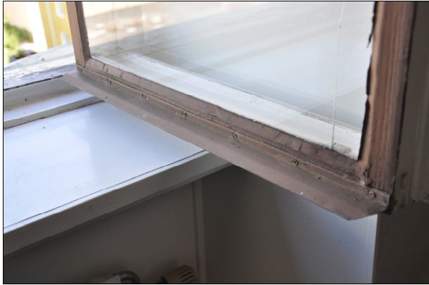
Bild 2: Byggnadens fönster var i behov av restaurering. När det skedde senast är okänt.

Byggnadens fönster var i dåligt skick med bortfallet kitt och flagnande färg. Fastighetsägaren ville låta restaurera fönstren, sammanlagt 81 stycken, under flera etapper. I den första etappen restaurerades 40 stycken fönster.