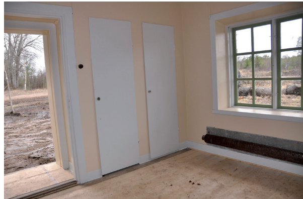
Väggarna och luckor målades ljusgula och vita. Vlm_kmvLS-2784