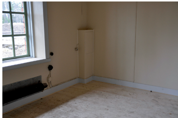
Ett nytt plankgolv lades in för att möjligen lägga in en linoleummatta. Vlm_kmvLS-2783