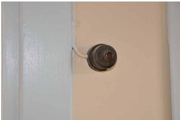
Elinstallationer lämnades kvar. Vlm_kmvLS-2785