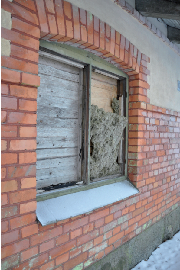
Fönstren saknades och var igensatta med plank. Vlm_kmvIM-2561