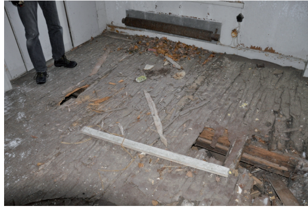
Linoleummattan och golvet var i fallfärdigt skick. Vlm_kmvIM-2571