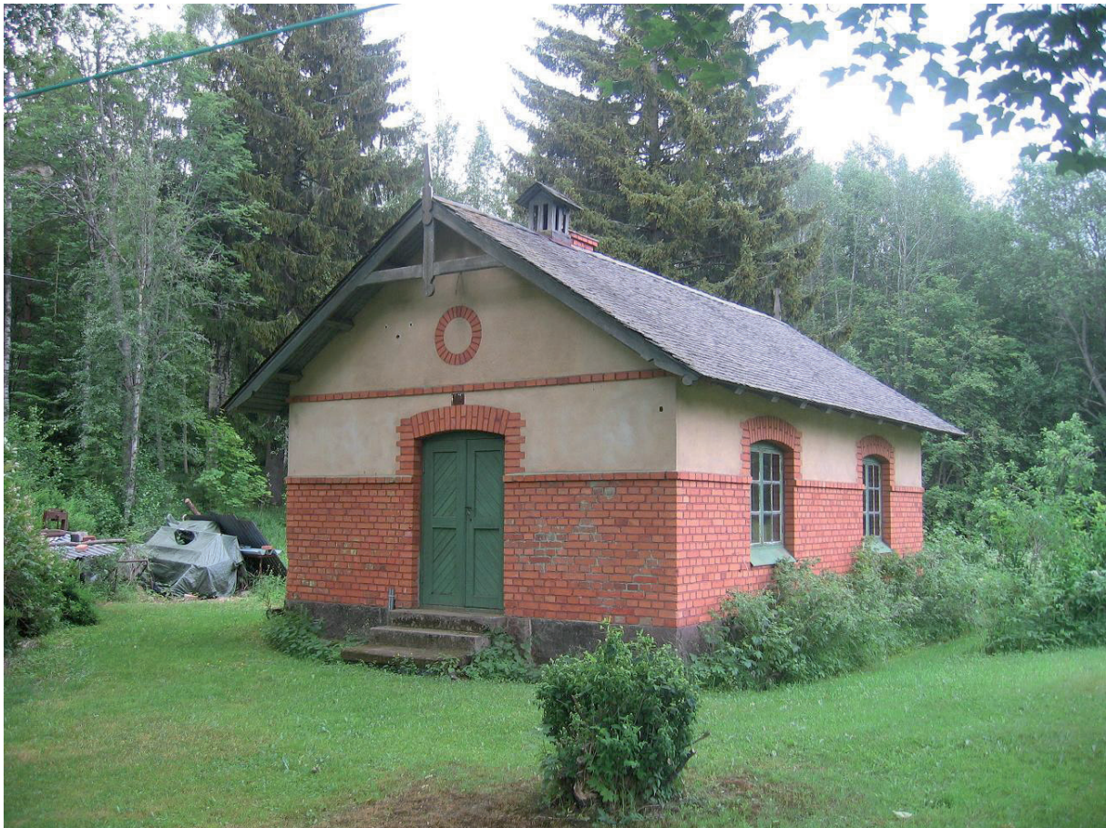
Tvättstugan i Dagarn med bevarade fönster och dörrar.

Tyvårr hade dörrar och fönster försvunnit men originalritningar fanns att tillgå för att tillverka nya. Karmarna skrapades fria från löst sittande färg. Därefter målades de med traditionell linoljefärg. Nya fönster och dörrar tillverkades utifrån nybyggnadsritningarna och jämförelse med tvättstugan i Dagarn som är en likadan byggnad med originalsnickrier bevarade. Även dessa målades med en traditionell linoljefärg (se kapitlet ”Avfärgning och målningsarbeten”).