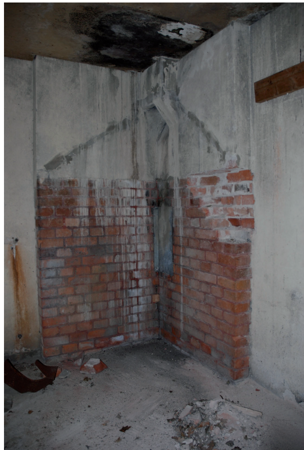
Vattenläckaget hade bidragit till skadorna. Vlm_kmvLS-1375