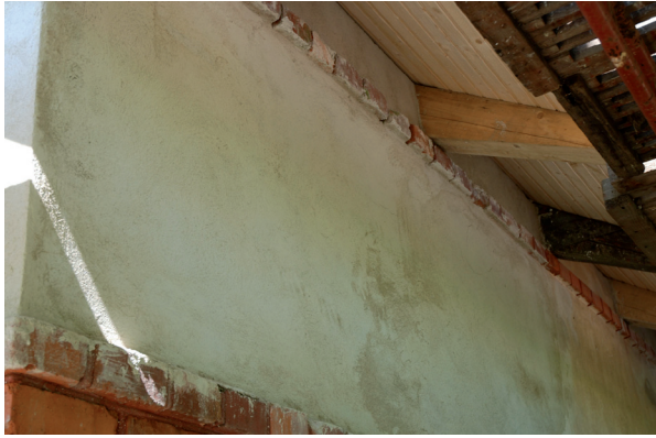
Skadorna i fasaden reparerades och putsades. Vlm_kmvLS-1843