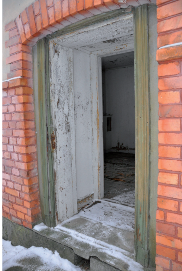
Även dörrar saknades, vilket bidragit til skadorna på byggnaden. Vlm_kmvIM-2576