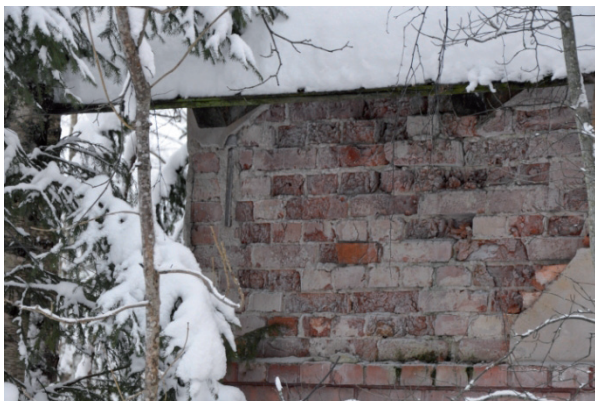
Fasaden vid det trasiga taket var hårt åtgånget av inrinnande vatten. Teglet har en varierad färgskala och röda fogar. Vlm_kmvIM-2567

Tegelmuren reparerades med tegel likt befintligt (trasigt tegel ersattes med nytt stortegel från Bältarbo tegelbruk) och skadorna i putsen reparerades. Fogarna ströks likt befintligt. Till putsning och murning användes ett hydrauliskt kalkbruk (Fabrikat Finja Hydrauliskt kalkbruk Fin, av Jura typ) till sockeln och ett vanligt luftkalkbruk till fasaden ( Fabrikat Finja Kalkbruk Fin). Putsfasaden avfärgades sedan i en ljus gul kulör (se kapitlet ”Avfärgning och Målningsarbeten”).