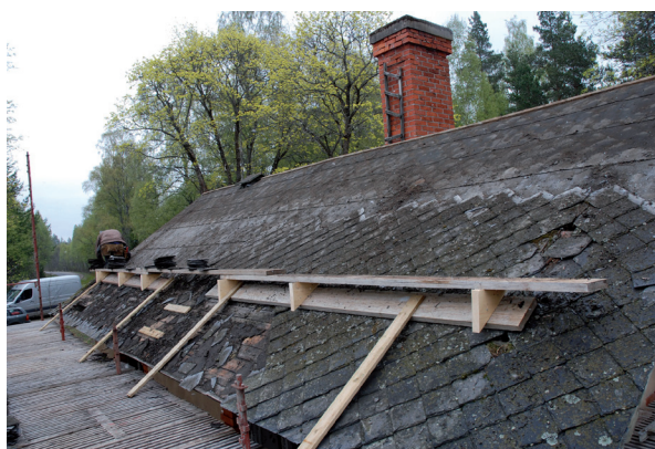
Skiffertaket under arbete. Plattorna plockades bort och sorterades.