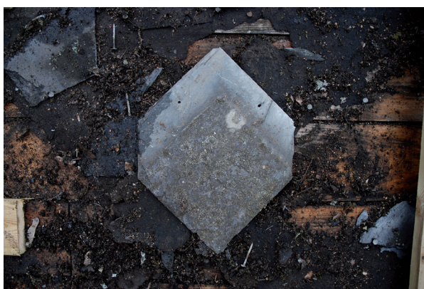
Skifferplattorna var spetsformade.