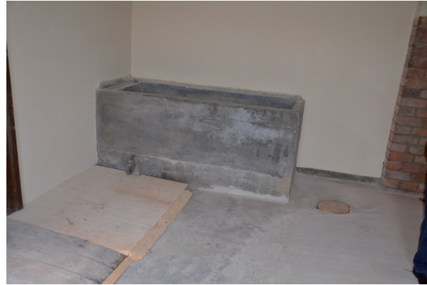
Väggarna ströks med en silikatfärg i en ljusgul kulör. Hålen i golvet täcktes för med plank. Vlm_kmvFE-1950