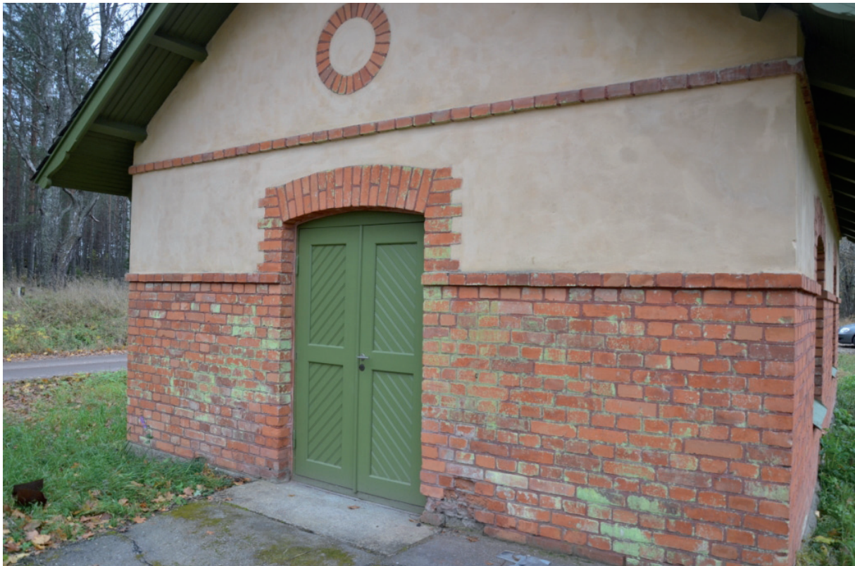
Nya dörrar till tvättstugedelen, den norra delen. Vlm_kmvFE-1955