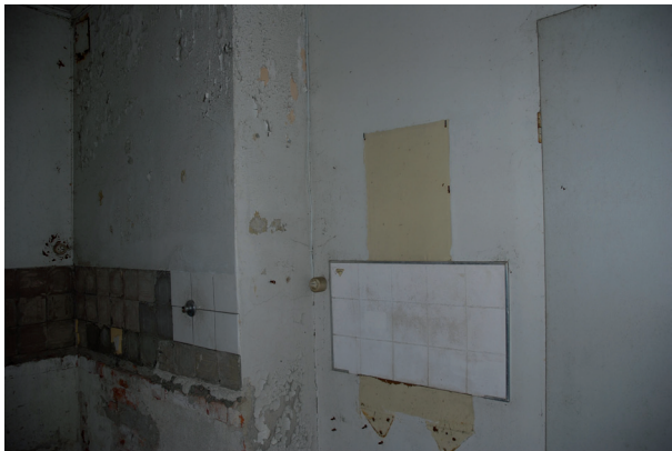
väggarna var inklädda i masonit, köksinredningen var utplockad. Vlm_kmvLS-1914