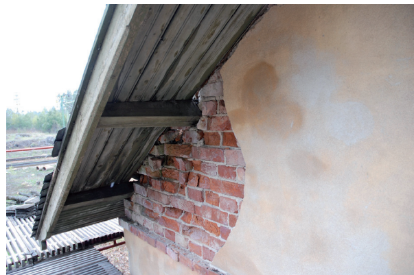
Tegelmuren i gavelröset hade även skador till följd av vattenläckage. Vlm_kmvLS-1371