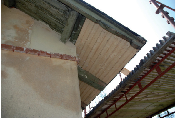
Takutsprånget kläddes in med dubbel pärlspont. Vlm_kmvLS-1841