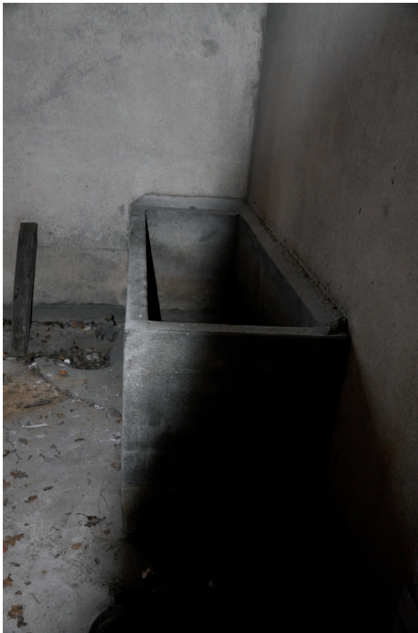
Den norra delen var i färdigt skick. Vlm_kmvIM-2560

Reparationer genomfördes i det gjutna golvet, ett större hål nära tvättkaret täcktes över med plank. De putsade väggarna reparerades och avfärgades med en silikatfärg i en ljus gul kulör. I taket satt asbestskivor som plockades bort och ersattes med pärlspont som målades i en mörkare gul linoljefärg (se kapitlet ”Avfärgning och målningsarbeten”). Delar av arbetet inne i utrymmet genomfördes av föreningen själva.