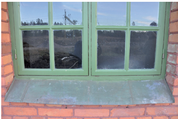
Nya fönster skapades utifrån originalritningar och med tvättstugan i Dagarn som förebild. Övre bilden: Vlm_kmvIM-931 Nedre bilden: Vlm_kmvIM-936