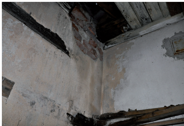
Takläckaget hade även bidraget till skador invändigt.