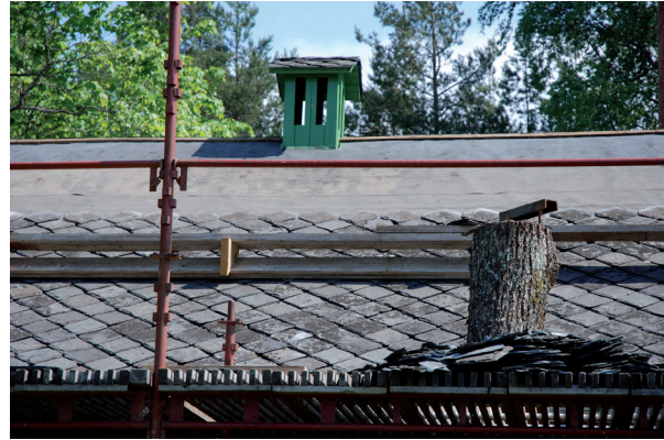
De skifferplattor som gick att återanvända lades tillbaka. Resten av taket kompletterades med nytt skiffer i samma dimension. Vlm_kmvLS-1847