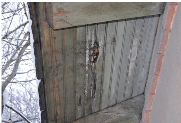
Pärlsponten som kläder takutsprånget hade kraftiga rötskador.

All vegetation nära byggnaden togs bort vilket borde förhindra framtida fuktskador. Skifferplattorna plockades ned och sorterades utefter deras kondition. Undertak och takstolar reparerades och, där det var nödvändigt, ersattes rötskadat virke med nytt. Ny takpapp lades på undertaket (fabrikat Icopal YAP 2200). De skifferplattor som gick att återanvända lades sedan tillbaka. Taket kompletterades sedan med nya skifferplattor i samma dimension som de gamla (från Grythyttan). Takfoten kläddes in med dubbel pärlspontspanel likt den befintliga som hade kraftiga skador. Panel och snickerier målades med traditionell linoljefärg i en grön kulör (se kapitlet ”Avfärgning och Målningsarbeten”). Skorstenen reparerades och fogarna ströks.