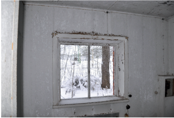
Södra utrymmet före åtgärderna, fönster saknades. Vlm_kmvIM-2568