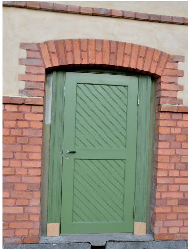
Nya dörrar tillverkades med Dagarn som förebild. Vlm_kmvIM-937