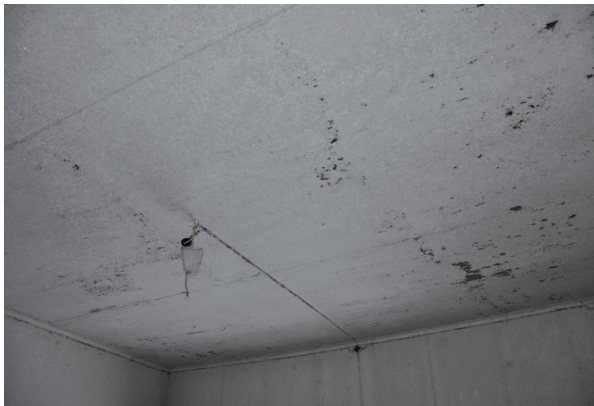
Taket var inklätt med masonit. Vlm_kmvIM-2572