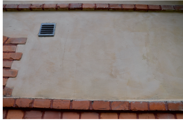
Fasaden avfärgades sedan med kalkfärg i en ljusgul kulör. Vlm_kmvFE-1960