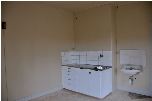
En ny köksinredning sattes in som plockades från ett rivningshus i Riddarhyttan. Vlm_kmvLS-2780