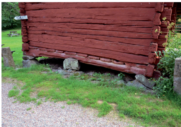
Syllstocken var rötskadad och hade böjt sig över stenen i mitten. Vlm_kmvFE-1629