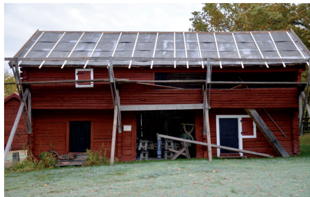
Byggnaden under arbetets gång, västra takfallet. Vlm_kmvFE-1931