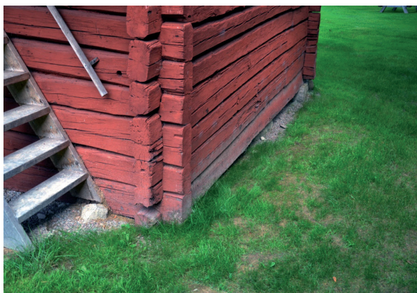
Byggnadens södra gavel låg mot marken. Vlm_kmvFE-1634