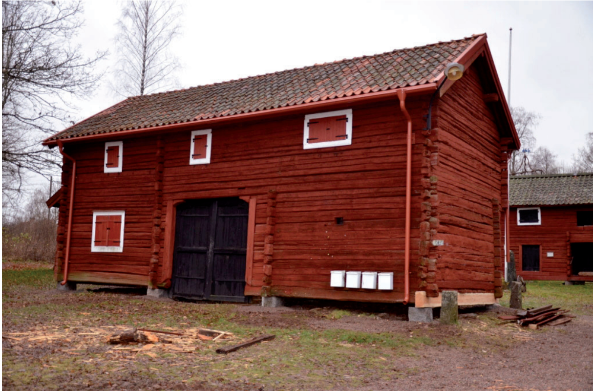
Byggnaden från öster efter restaurering. Nya vindskivor av röd plåt och hängrännor monterades på byggnaden. Vlm_kmvFE-2018