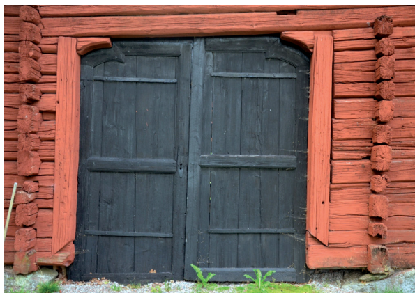
Portarna gick nästan ned till mark. Vlm_kmvFE-1632