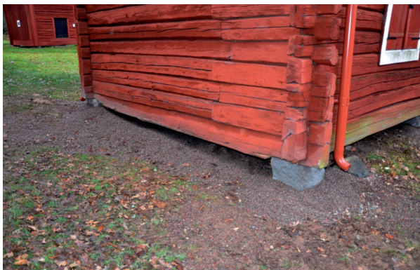
Södra gaveln efter att byggnaden höjts. Vlm_kmvFE-2020