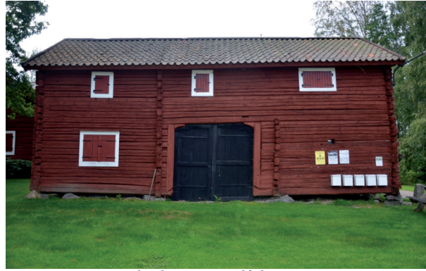
Timmerstommen hade satt sig då hörnstenarna var dåligt upppallade. Vlm_kmvFE-1642