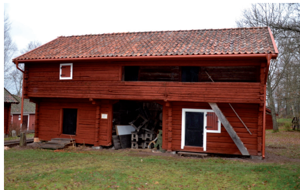
Byggnaden från väster efter åtgärderna. Vlm_kmvFE-2021