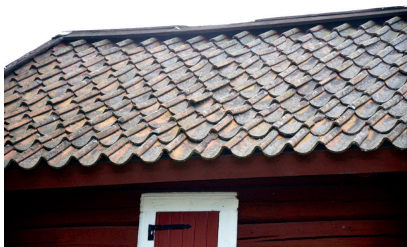
tegelpannorna låg snett då läkten var rötskadad, vissa pannor var spruckna. Vlm_kmvFE-1640