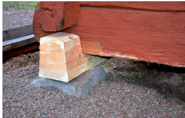
Knuten utformades likt befintlig. Vlm_kmvFE-2017