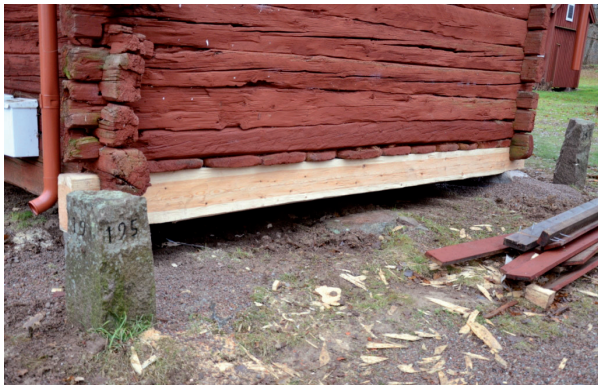
Norra gavels syllstock byttes ut mot ny. Vlm_kmvFE-2014