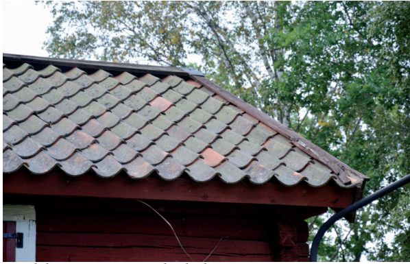
Vindskivorna var rötskadade. Vlm_kmvFE-1641