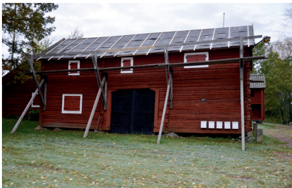
Teglet plockades bort och på pärten lades takboard. Vlm_kmvFE-1928